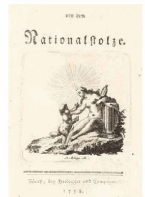
Johann Georg Zimmermann