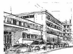
La Bibliothèque nationale vue de l'extérieur, dessin : Basil Linder

Le taux d'occupation moyen des places de travail a été de 36 % sur l'année (2010: 39 %). Les nouvelles salles publiques aménagées en 2010 ont rencontré un bon écho ce qui n'a pas empêché un recul de la fréquentation. La publicité sur différents canaux, notamment sur Facebook, n'a inversé cette tendance que l'espace de quelques mois. On attend de la rénovation en cours de l'infrastructure technique des salles publiques qu'elle entraîne une hausse durable de la fréquentation. Les usagers souhaitent pouvoir disposer de leurs outils techniques habituels à la bibliothèque, comme en atteste la demande croissante d'accès WLAN.