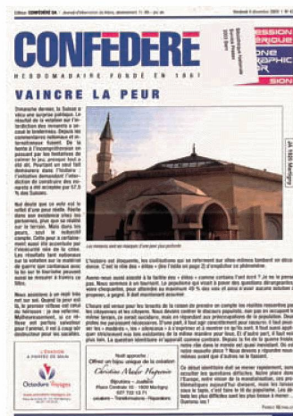
Un des journaux numérisés : Le Confédéré, page de titre de l'édition du 12.4.2009