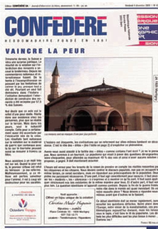
Un des journaux numérisés : Le Confédéré , page de titre de l'édition du 12.4.2009