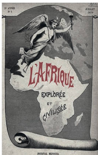
Une des revues numérisées : L'Afrique explorée et civilisée , page de titre du 1 er numéro, juillet 1879

Au chapitre des manifestations culturelles, les temps forts de l'année ont été les célébrations du 20 e anniversaire des ALS 31 à Berne et l'exposition consacrée à Mario Botta 32 au Centre Dürrenmatt Neuchâtel (CDN). 6312 personnes (2010 : 8341) ont pris part à l'une ou l'autre manifestation de la BN : exposition, manifestation ou visite guidée. Le recul par rapport à l'an passé s'explique par l'absence de grande exposition. Le CDN a enregistré 13 594 visites (2010 : 12 164) soit le plus grand nombre de son histoire.