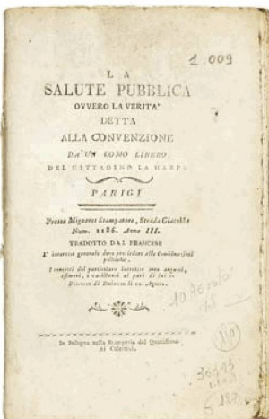
Frédéric César de La Harpe