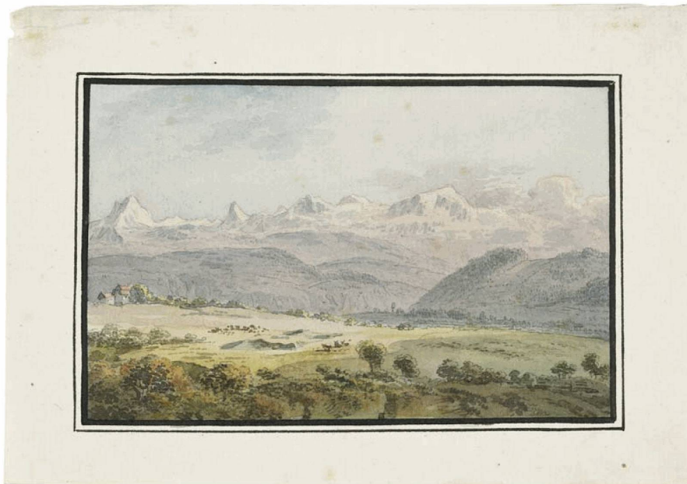
Heinrich Rieter, Blick auf die Alpenkette bei Thun , aquarelle. Don de la fondation Graphica Helvetica/Galerie Kornfeld pour la collection Gugelmann

–, sans titre, « Für Judith », collage, 1979.