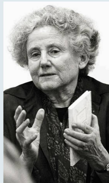
Erica Pedretti, 24.3.2010