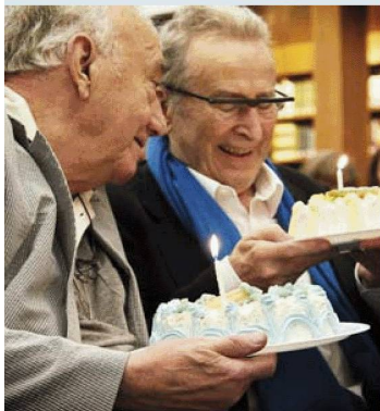
Daniel Spoerri (à gauche) et Karl Gerstner, 18.6.2010