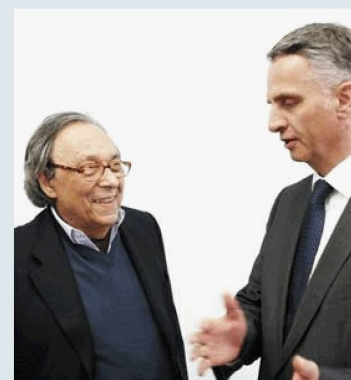
Jean Starobinski (à gauche) s'entretenant avec le Conseiller fédéral Didier Burkhalter, 18.11.2010