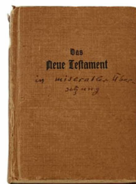
De la bibliothèque de Ludwig Hohl