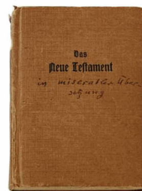
De la bibliothèque de Ludwig Hohl