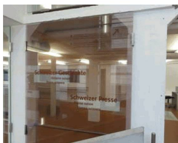
Les collections spécialisées