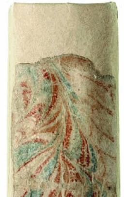
Après les travaux de conservation : dos de livres, affiches

La collection de documents nés numériques 14 s'est accrue de 2493 publications et comprend quelques 11 millions de fichiers pour un total de 136 gigabytes (en 2008, 1406 publications, 15 300 fichiers, 7,91 gigabytes). On relèvera en particulier la publication en ligne de la Feuille officielle suisse du commerce . L'édition quotidienne comprend environ 1500 entrées qui sont archivées et conservées à long terme avec leur certification légale. Les sites internet d'importance patrimoniale continuent à être collectés en collaboration avec les bibliothèques cantonales suisses. Le développement de l'outil de consultation de la collection électronique se poursuit selon les plans. Il devrait être opérationnel à la fin de 2010.