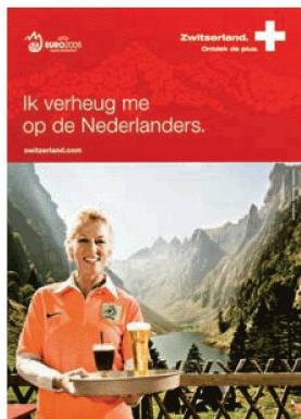
Documents concernant le Championnat européen de football, Euro08 , provenant de la collection des publications des associations