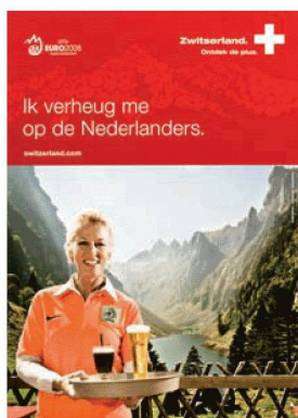
Documents concernant le Championnat européen de football, Euro08 , provenant de la collection des publications des associations