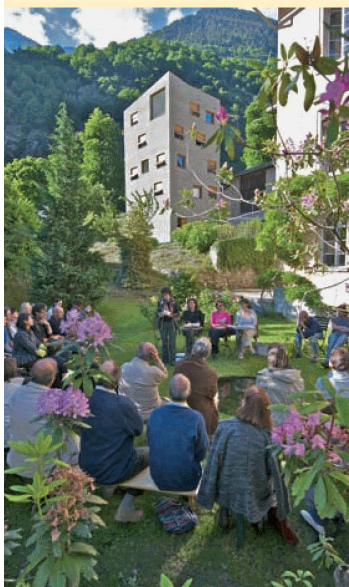
Vernissage du nouveau numéro de Quarto : Bregaglia / Bergell, © St. Moritz PresseFotos

La poésie d'Andri Peer passe pour moderne, difficile et même, assez souvent, incompréhensible. Le but du colloque de Lavin était de montrer que cette poésie se nourrit aussi des traditions et qu'elle se prête à de multiples lectures. Cette manifestation était une coproduction du centre culturel La Vouta, du Fonds national suisse de la recherche scientifique, de l'Université de Zurich et des ALS.