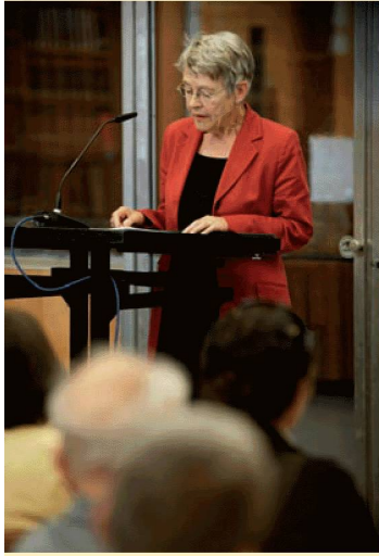
Klara Obermüller, Allocution à la mémoire d'Annemarie Schwarzenbach