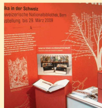
La BN à la foire Buch.08