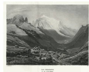
La BN participe au projet ViaticAlpes . Les images des Alpes dans les récits de voyage de la Renaissance au XIX e siècle ( www.unil.ch/viaticAlpes ).

La BN a été active dans le domaine de la numérisation : outre la création, déjà mentionnée, de la plate-forme Digicoord , les efforts se sont concentrés sur la numérisation des journaux. Elle a pu être institutionnalisée en Suisse romande grâce à une convention-cadre passée avec Presse Suisse . La BN participe à la numérisation de journaux lorsque leur éditeur et une bibliothèque cantonale ou locale sont également engagés dans le projet. Le Journal de Genève a été le premier quotidien à être numérisé selon ce principe : depuis décembre, il est accessible en ligne, gratuitement. 10 L'éditeur du quotidien Le Temps a conduit le projet, auquel la Bibliothèque de Genève a également collaboré. La BN n'a pas seulement apporté une contribution financière dans cette entreprise, mais aussi ses compétences en la matière. Des conventions pour la numérisation de la Gazette de Lausanne et des deux quotidiens neuchâtelois, L'Express et L'Impartial , ont été signées au cours de l'exercice.