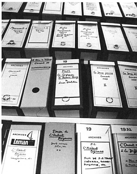
Le Fonds Jacques Chessex au moment de sa réception.

nue une œuvre qui s'enrichit considérablement. Les romans et les récits se multiplient : L'Ardent Royaume (1975), Les Yeux jaunes (1979), Judas le Transparent (1982), Jonas (1987), Morgane Madrigal (1990), La Trinité (1992), Le Rêve de Voltaire (1995), La Mort d'un Juste (1996). Les nouvelles donnent naissance à deux recueils : Le Séjour des morts (1977), Où vont mourir les oiseaux (1980). La poésie à laquelle Chessex revient périodiquement se traduit par plusieurs nouveaux livres : Élégie soleil du regret (1976), Le Calviniste (1983), Comme l'os (1988), Les Aveugles du seul regard (1991), Les Élégiés de Yorick (1994). Des chroniques et morceaux émergent deux titres : Reste avec nous (1969) et Feux d'orée (1984). Jacques Chessex s'affirme également dans la critique littéraire : Charles-Albert Cingria (1967), Les Saintes Écritures (1972), Bréviaire (1976), Flaubert ou le Désert en abîme (1991). Il y aurait lieu de mentionner encore les contes, les écrits sur l'art, les préfaces et autres collaborations. Durant toutes ces années, Jacques Chessex a aussi régulièrement collaboré à de nombreuses revues ainsi qu'à des journaux, notamment 24 Heures de 1970 à 1991 ( Humorales ), puis Le Nouveau Quotidien en 1992 et 1993 ( Chronique de Jacques Chessex ).