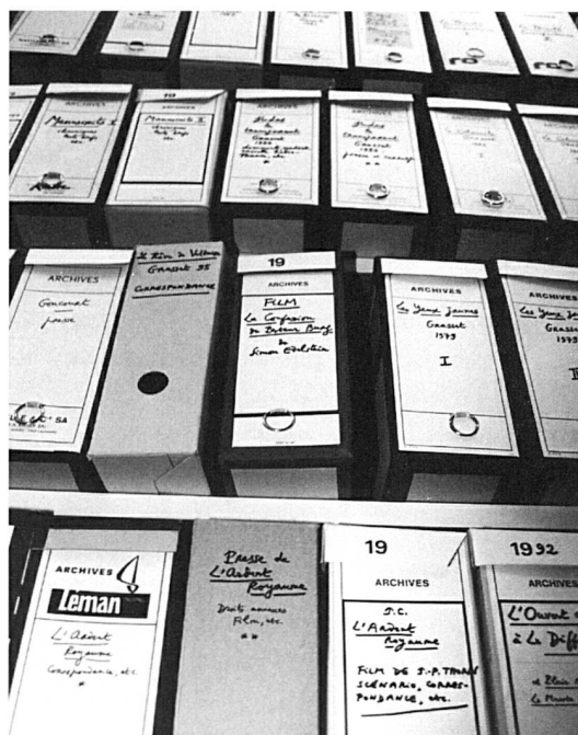
Le Fonds Jacques Chessex au moment de sa réception.

nue une œuvre qui s'enrichit considérablement. Les romans et les récits se multiplient : L'Ardent Royaume (1975), Les Yeux jaunes (1979), Judas le Transparent (1982), Jonas (1987), Morgane Madrigal (1990), La Trinité (1992), Le Rêve de Voltaire (1995), La Mort d'un Juste (1996). Les nouvelles donnent naissance à deux recueils : Le Séjour des morts (1977), Où vont mourir les oiseaux (1980). La poésie à laquelle Chessex revient périodiquement se traduit par plusieurs nouveaux livres : Élégie soleil du regret (1976), Le Calviniste (1983), Comme l'os (1988), Les Aveugles du seul regard (1991), Les Élégies de Yorick (1994). Des chroniques et morceaux émergent deux titres : Reste avec nous (1969) et Feux d'orée (1984). Jacques Chessex s'affirme également dans la critique littéraire : Charles-Albert Cingria (1967), Les Saintes Écritures (1972), Bréviaire (1976), Flaubert ou le Désert en abîme (1991). Il y aurait lieu de mentionner encore les contes, les écrits sur l'art, les préfaces et autres collaborations. Durant toutes ces années, Jacques Chessex a aussi régulièrement collaboré à de nombreuses revues ainsi qu'à des journaux, notamment 24 Heures de 1970 à 1991 ( Humorales ), puis Le Nouveau Quotidien en 1992 et 1993 ( Chronique de Jacques Chessex ).