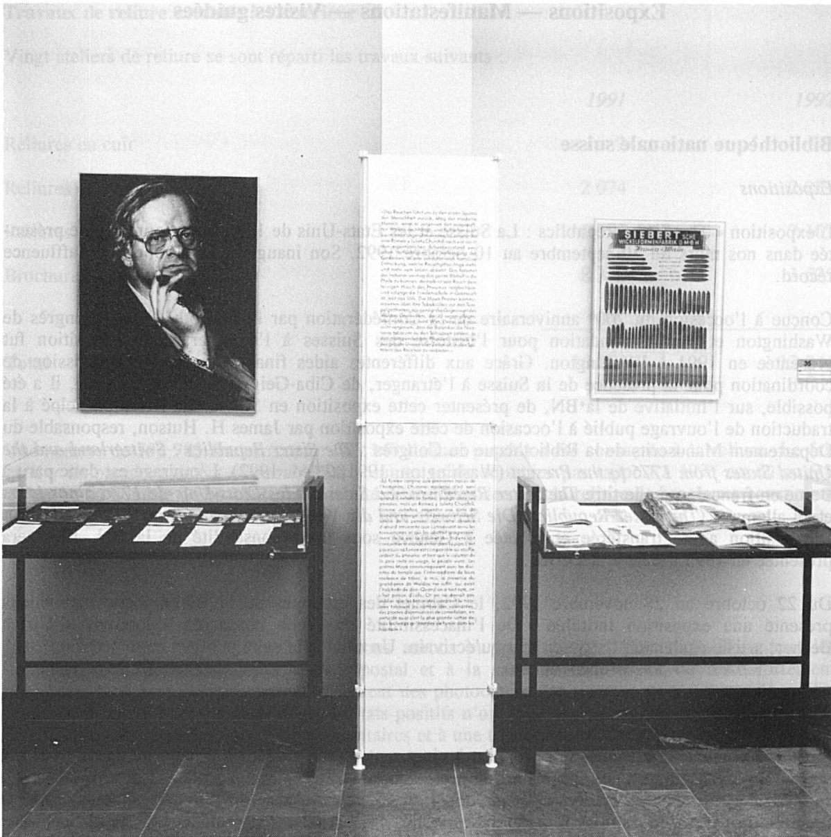
Quelques objets présentés dans le cadre de l'exposition consacrée aux romans de Hermann Burger.

Du 29 avril au 2 mai : Salon du livre, Genève : « Friedrich Glauser et l'inspecteur Studer ».