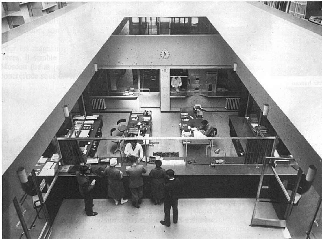
Le prêt vu de la galerie située au troisième étage des magasins

L'édifice marque le début d'une époque nouvelle, celle où l'architecture se détourne du luxe et de l'ornementation pour rechercher avant tout une parfaite adéquation de la construction aux besoins de ses usagers. Du revêtement des sols au mobilier (créé spécialement pour le bâtiment et presque entièrement renouvelé depuis), tout a été pensé dans un souci de fonctionnalisme. Chaque corps du bâtiment, composé d'une ossature (structure de soutien) et de murs non porteurs, a été conçu dans un esprit purement utilitaire. On a renoncé à toute ornementation (mais non à toute qualité esthétique). Les dimensions de tous les éléments de la construction se rapportent à une mesure fondamentale, bien connue des bibliothécaires : la distance « d'axe en axe » entre les rayonnages. Tout se passe donc comme si le bâtiment avait été construit sur mesure pour habiller les rayonnages qui en forment le coeur.