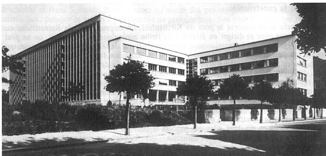
Vue du nord-ouest : au premier plan la Bernastrasse, à gauche les magasins sur huit étages, la terrasse de la salle de lecture ouvrant sur le jardin

Pour les magasins, Alfred Oeschger a imaginé une construction en hauteur, véritable silo à livres. Il semble s'être inspiré des projets que Wesnin a conçu pour la bibliothèque Lénine à Moscou (hélas jamais réalisée). Depuis, l'idée de la tour de livres a fait son chemin et s'est concrétisée sous diverses formes (parfois rebutantes, comme à Leipzig).