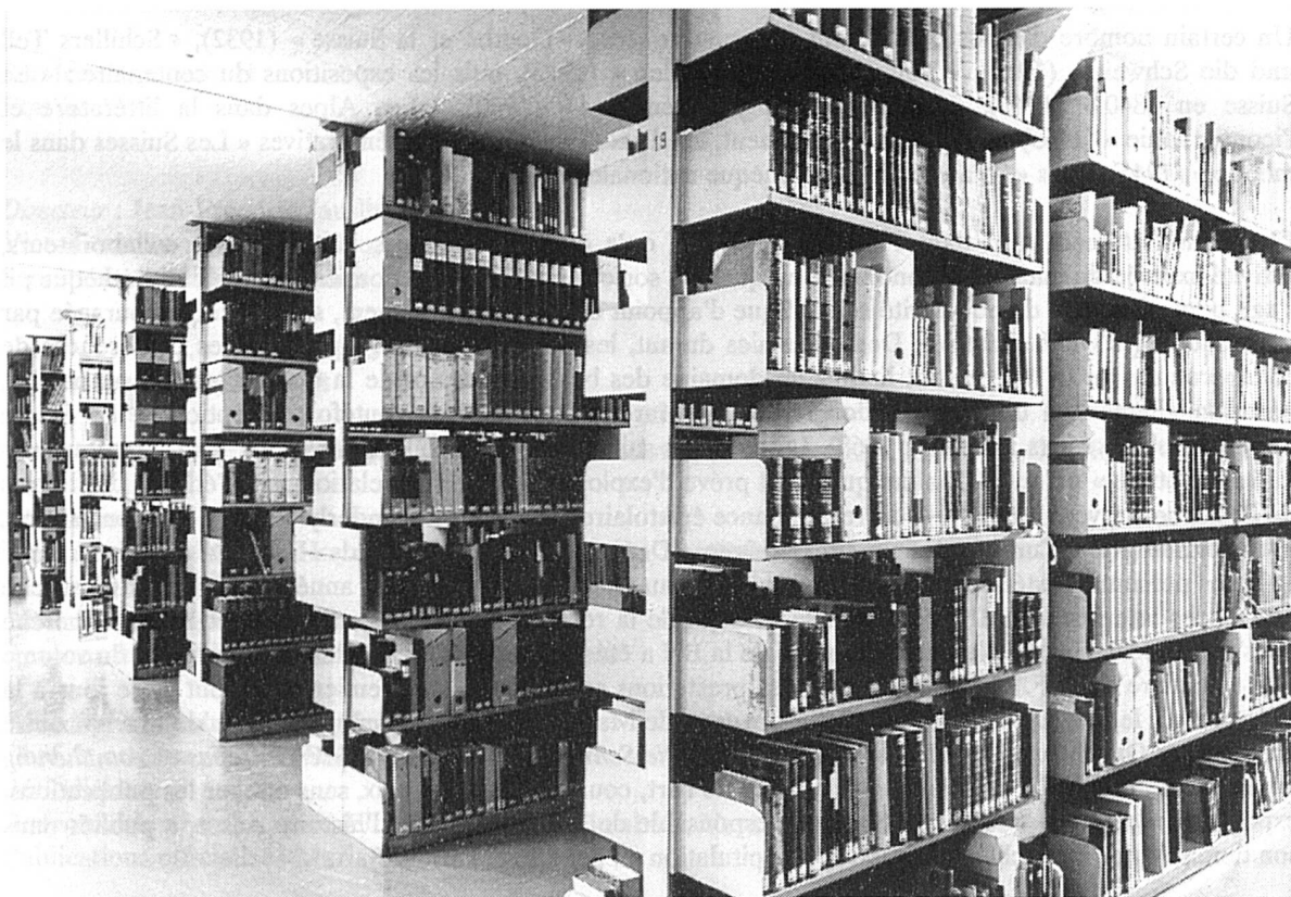
Magasin des « anciens Helvetica »