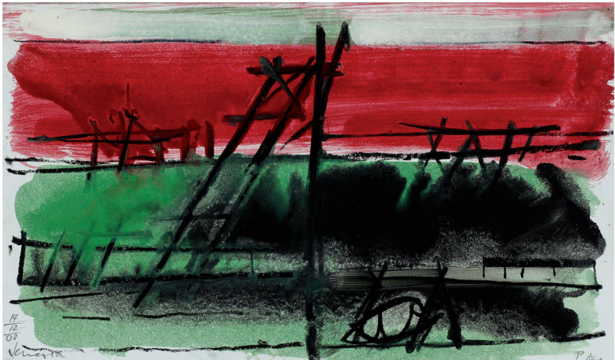
Studio (laguna con paine), 2008, gessetto nero e olio su carta, 22x38 cm

Paolo Pola vede, rileva, annota, disegna, colora. Decine e decine di pagine fitte di appunti, schizzi, fotografie, disegni, pitture. È il momento dell'accumulo di materiali con un ritmo così consequenziale e significativo da diventare esso stesso, il cahier d'artiste , opera d'arte. Tanto più che pagina dopo pagina prende sostanza una progressiva elaborazione dei dati: le varie tessere vanno a comporre il suo personale mosaico di Venezia. E sapete come? Nel continuo andirivieni tra quella straordinaria realtà fuori dal tempo che è Venezia e questa normalità del quotidiano che in lui (e in parte anche in noi) è di continuo confrontata con la realtà dei Grigioni. Intanto però quel paradigma culturale che s'è portato dietro – una sorta di zaino, di gravame, ma anche di indirizzo e punto di riferimento - gradualmente è andato sfumando sotto i colpi di un'ondata senza fine di sollecitazioni avvicinate, accolte ed elaborate una ad una attraverso la mediazione della scrittura e della pittura. Con la cultura originaria però sempre sul chi vive, pronta a riemergere, ed infatti basta un trafiletto sulla “dea Retia”, su un tempio paleoveneto individuato in una campagna di scavi nell'entroterra veneto, per d'improvviso creare un ponte dal mare ai monti tra Venezia e i Grigioni. Come dire che il sismografo di Paolo Pola era sempre attivo e reattivo.