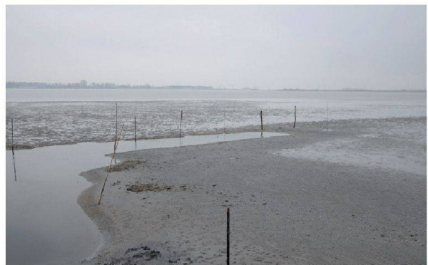
Venezia, «Laguna con paine» (foto: Roger Faedi)

(foto: Gesa Litchinger Denise: particolare)