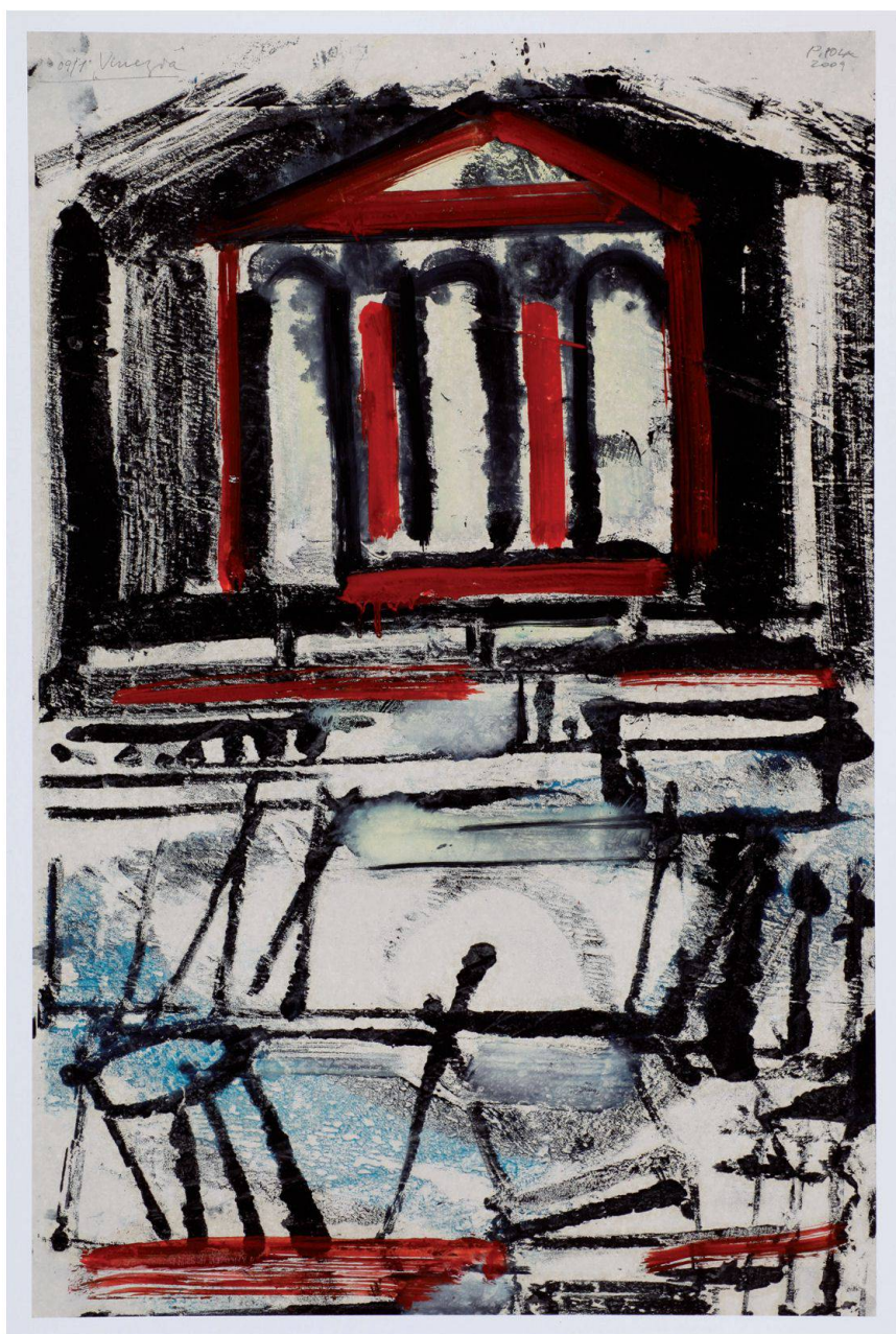
Omaggio a Palladio (Venezia), 2009, olio su carta velina, 75x50 cm

con ordine, un passo, un'informazione dopo l'altra nel combinare in modo significativo i vari elementi: le immagini, il paesaggio, l'emozione, la storia, l'arte ecc. Parte radente dalla prospettiva zero di un orizzonte comunque mosso dall'oscillazione del livello dell'acqua della laguna, che cambia la natura del paesaggio e dei monumenti dando ebbrezza o pace allo sguardo. Poi s'addentra nella composita, vertiginosa realtà veneziana lungo un'indagine capillare nel continuo andirivieni tra Natura (mare, laguna, cielo...) e Artificio, ossia tutti i segni, nessuno escluso, del passaggio dell'uomo. Dove il segno più presente e diffuso è quello dell'arte – urbanistica, architettura, pittura, scultura, decorazione... – con una concentrazione pressoché insopportabile.