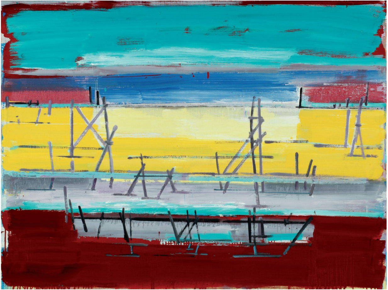
Partitura veneziana, 2009, olio su tela, 90x120 cm

bert Morris e Sol LeWitt, architetti e scultori degli States che hanno affrontato il tema dello spazio sulla base anche, anzi soprattutto, della storia dell'arte, in particolare in quel periodo splendidamente cruciale che va dal pre-Rinascimento al Barocco. Infatti, una volta assimilato e ordinato il tutto e di più di informazioni anche visive prodotto dall'incontro con Venezia, ecco che nella pittura di Pola si è fatto largo in modo netto il tema dello spazio. Non tanto in relazione al "dialogo tra i segni" di cui giustamente ha parlato Luciano Caprile nell'introdurre la mostra di Genova nel 2005 (alla Roberto Rotta Farinelli, Galleria d'arte moderna e contemporanea), quanto riferito al dove inscenare questo dialogo.