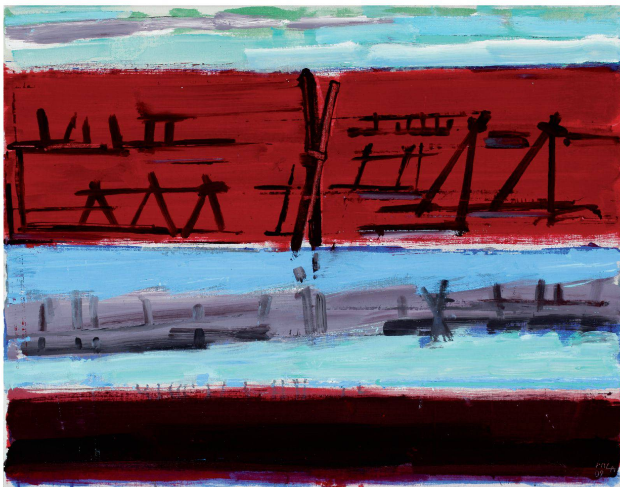
Laguna 1, 2009, olio su tela, 70x90 cm

Già che ci sono, mi prendo la libertà di alcuni raffronti e sapete dove vado a cercarli? Proprio tra i “minimalisti”, artisti del calibro di Dan Flavin, Donald Judd, Ro-