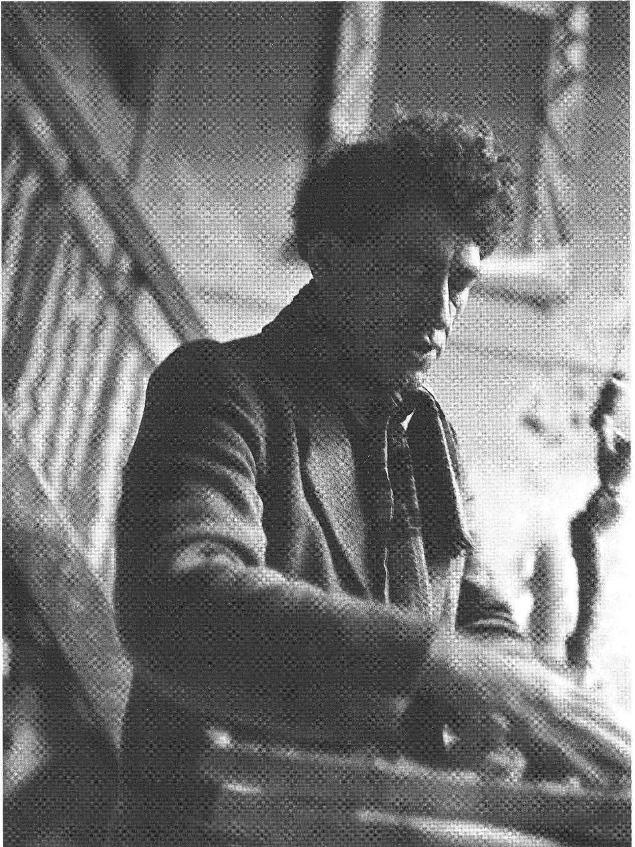
Alberto Giacometti, (manca la data)