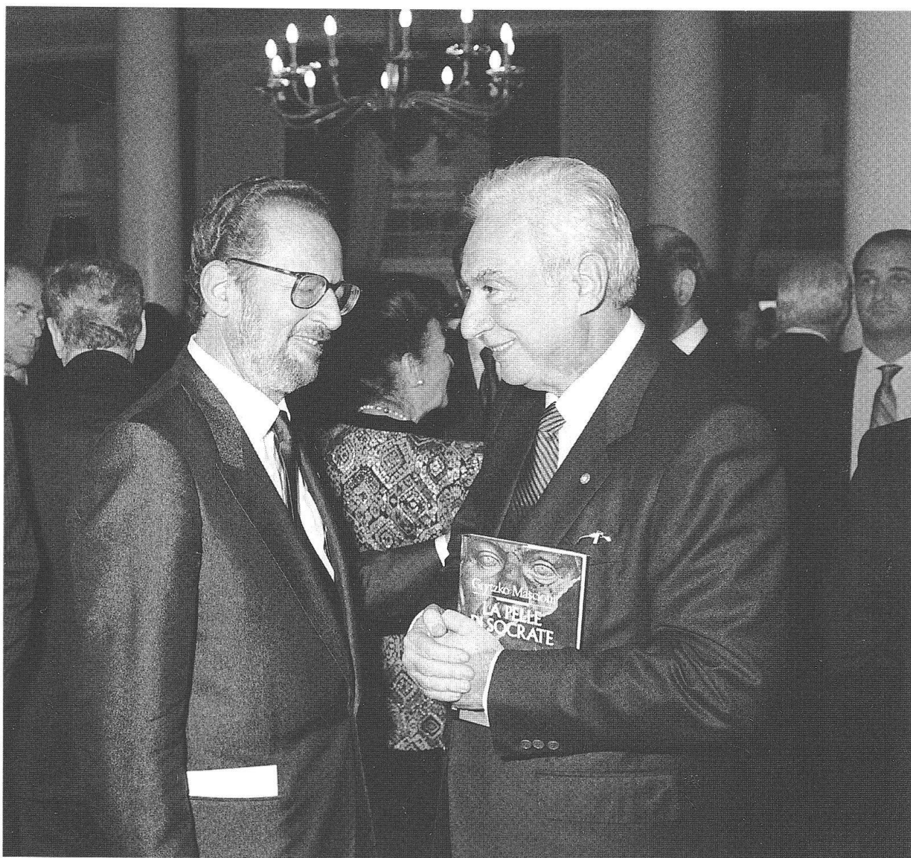
Grytzko Mascioni con Francesco Cossiga

Innanzitutto quello di resistere eroicamente alle mode, di non lasciarsi condizionare dal mercato letterario. Chi si mette a scrivere deve, o nella solitudine o nel confronto con gli altri, cercare se stesso, trovare qualcosa da dire, avere molta umiltà e volontà. Non bisogna lasciarsi sedurre da miti effimeri. Non credo per esempio che la volgarità porti da nessuna parte. Non è che una scappatoia facile per avere un'aria di contemporaneità che in realtà è solo una forma di fuga dai problemi reali.