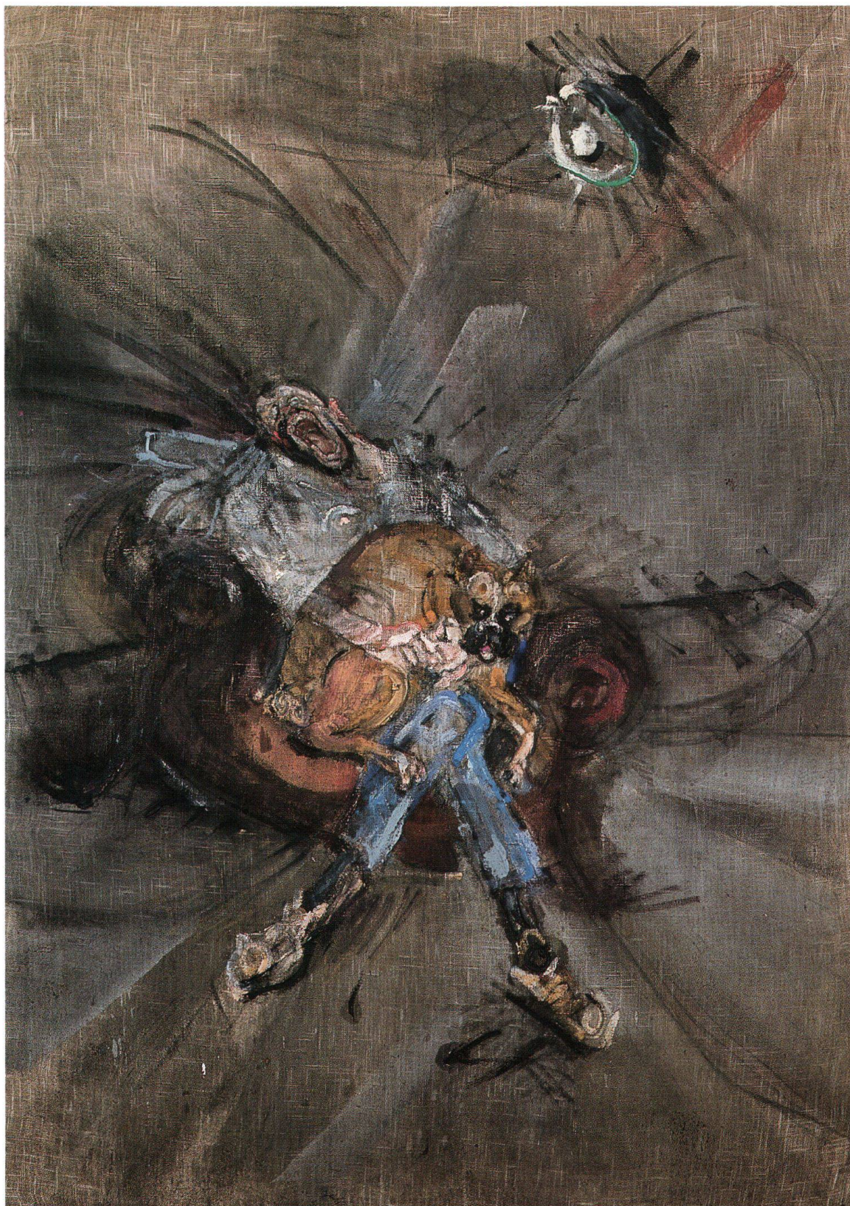
Varlin, L'uomo col cane, 1973-75, olio e carboncino su juta, 239x170 cm, collezione privata (cat. 1350)