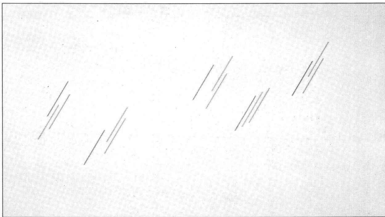
Damiano Gianoli, «Spazio e colore», 1/1988, 90x180 cm., acrilico/tela