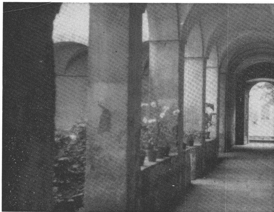
Corridoio del chiostro con porta che dà sul giardino