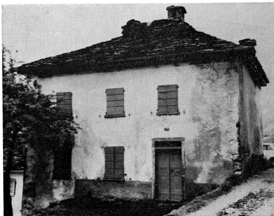
La casa dei nonni a Doira

DÈIRA , nome proprio di frazione: Doira «Ho nel cuore l'ardente desio di veder del castello le mura, veder Doira di fronte, sicura, sopra un masso sicuro giacer».