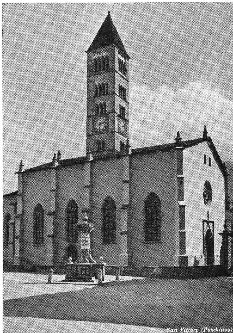
Collegiata di San Vittore a Poschiavo, vista da nord