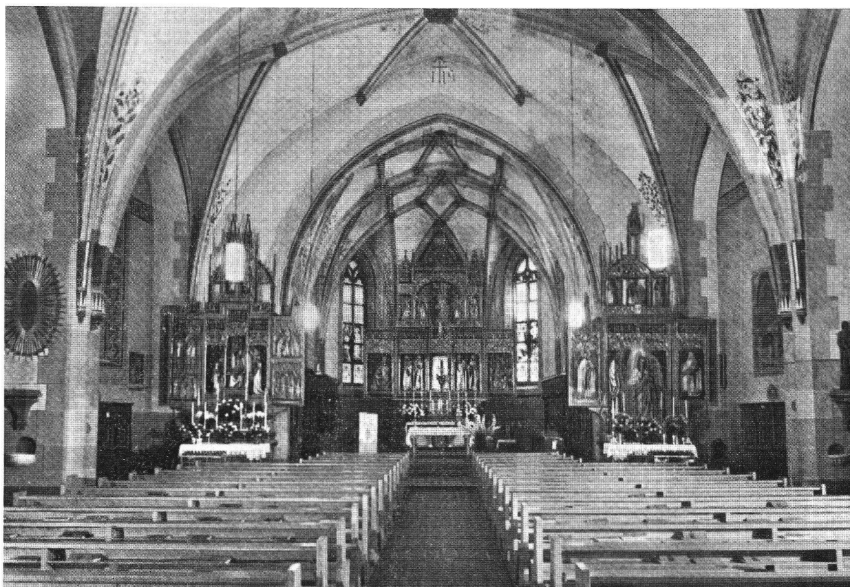
Collegiata di San Vittore a Poschiavo: interno

figlio di Lodovico il Pio, che amministrava l'Italia, nell'824 cedette nuovamente Poschiavo al Vescovo di Como. L'Abate di San Dionigi, appoggiandosi a quanto decretato dal papa, fece le sue lagnanze, e così Poschiavo venne nuovamente a trovarsi sotto la giurisdizione di San Dionigi, prima nell'anno 841 e nuovamente per conferma nell'anno 847, sempre per mezzo degli uffici interposti in questo senso da Lotario.