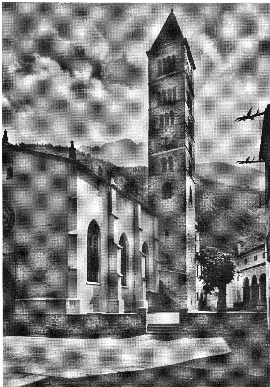
Collegiata di San Vittore a Poschiavo, vista da sud