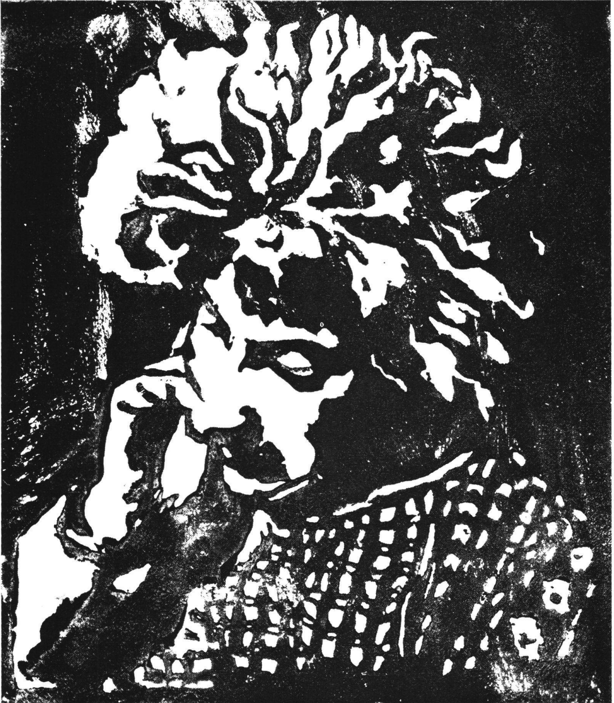
G. GIACOMETTI: Annetta (silografia)