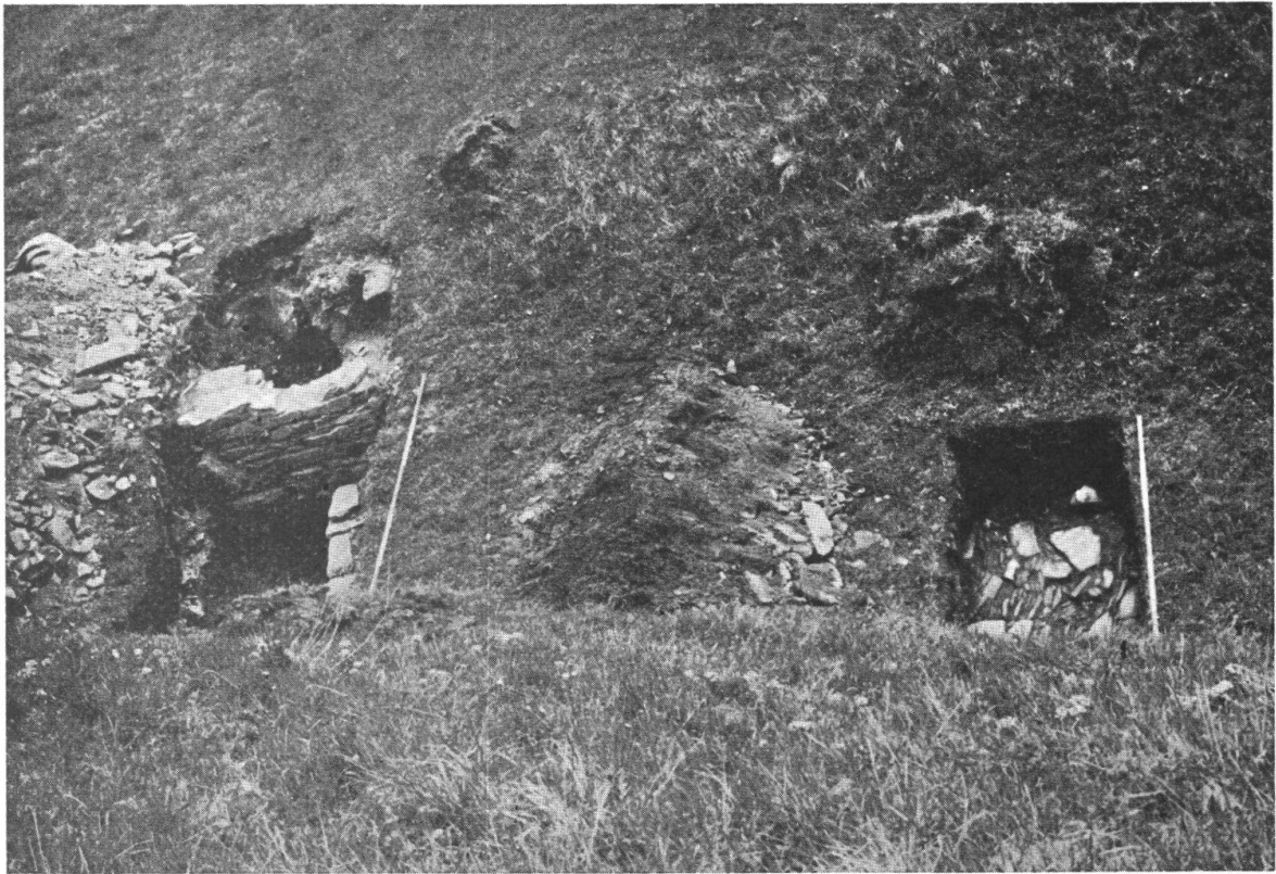
Mesocco : Resti di strada romana presso il ponte di Anzone. A destra il selciato.

bolla di indulgenze dell'archivio di Lostallo), fu costruita in parte sullo stesso sedime della strada primitiva.