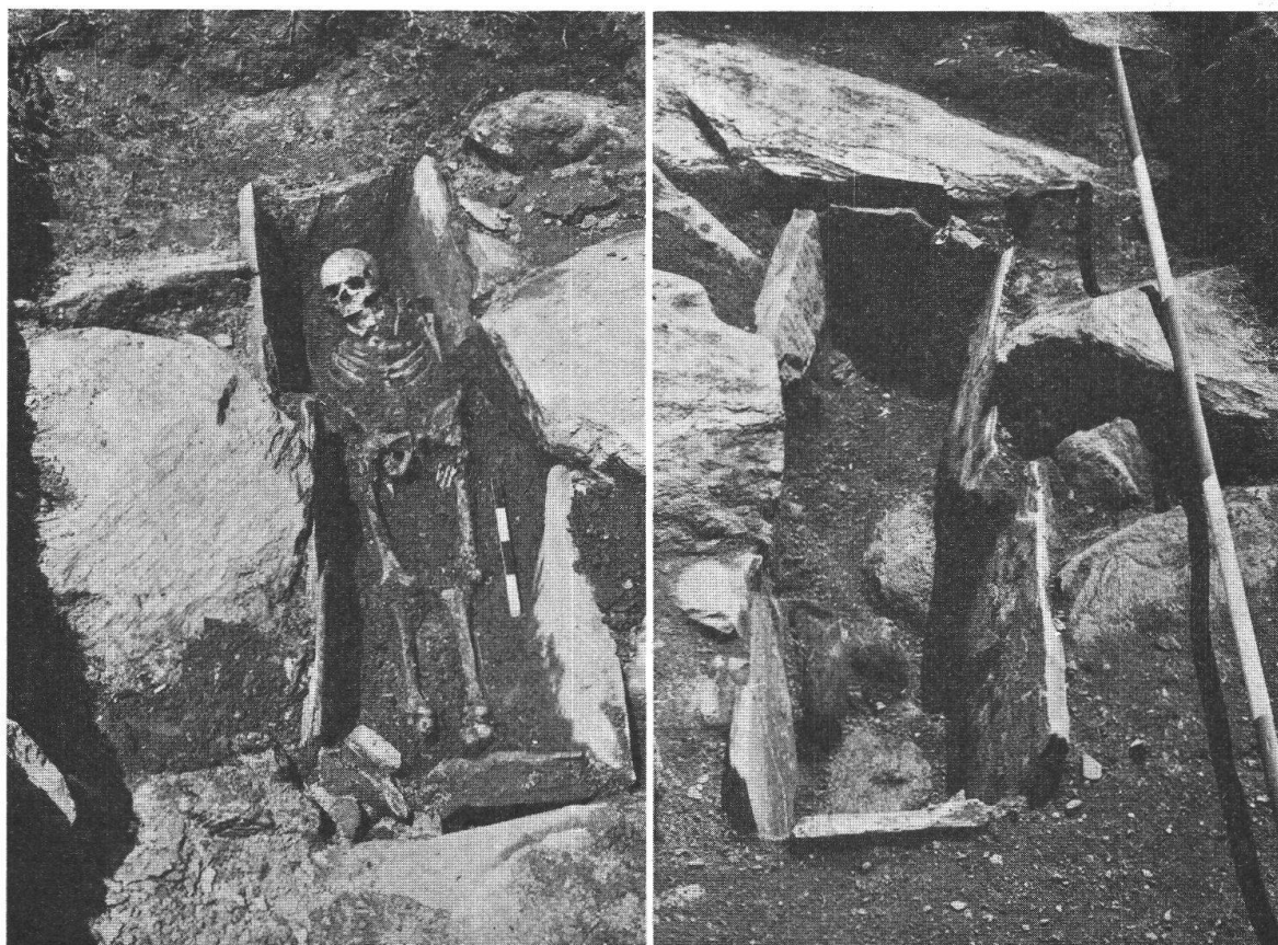
Mesocco: Tomba di Dangio

sta, a giudicare dalla fotografia, non dovrebbe essere stata saccheggiata. In uno dei due vani c'era un vaso di forma sferica, di argilla rossiccia, nell'altro carbone di legna, resti di oggetti in ferro fra cui forse un coltello, chiodi e terra nera.