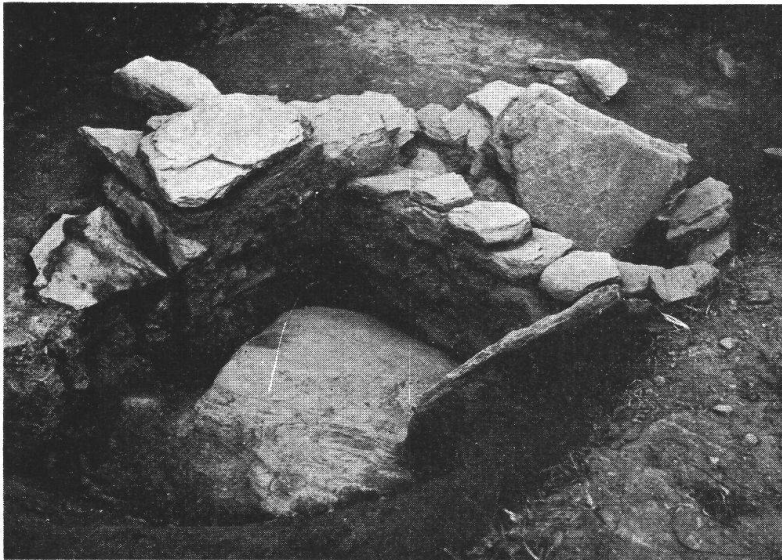
Mesocco, Crimea: Tomba a due vani.

fotografia da noi pubblicata nell'annuario della Società svizzera di preistoria del 1943, tavola XV, fig. 2. 7)