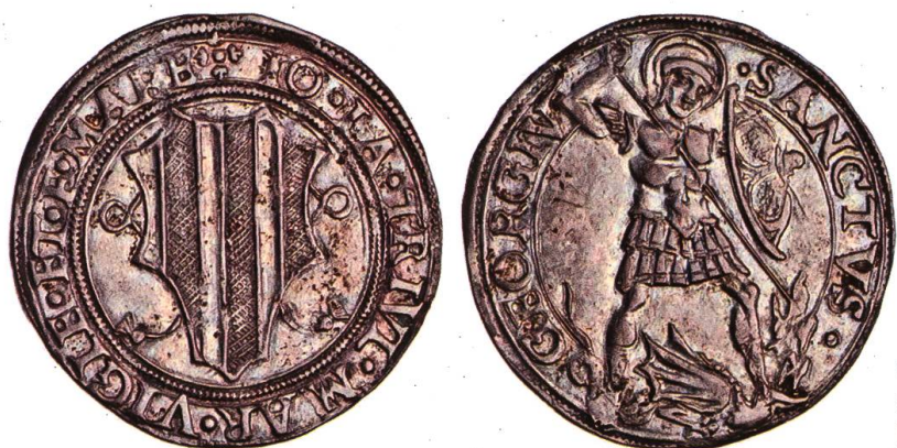
Grosso da sei soldi (argento) coniato sotto Gian Giacomo Trivulzio