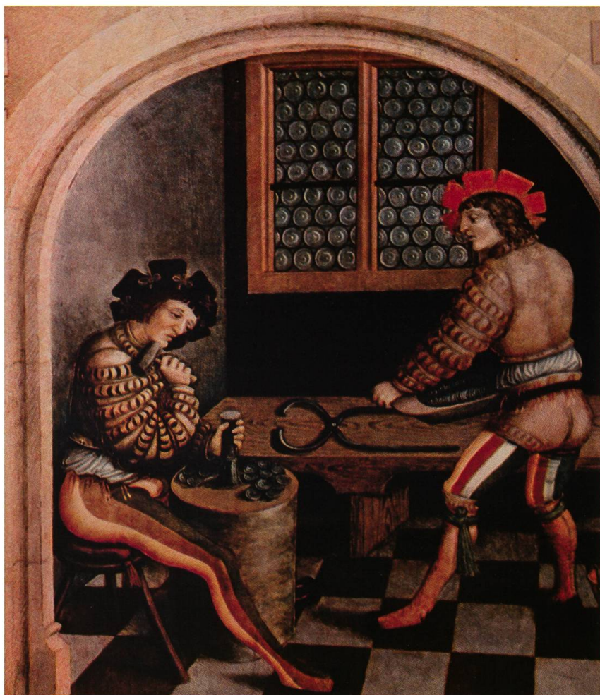
Pala d'altare della chiesa di Sant'Anna ad Annaberg (dettaglio)

tenaglie per toglierli dal fuoco, una particolare tenaglia detta moietta, catini di rame, canali (ovvero forme) di ferro per gettare l'argento, forbicioni per tagliare le lamine ottenute, pale di ferro. Da notare che una moietta è raffigurata nella celebre pala d'altare della chiesa di Sant'Anna ad Annaberg (Sassonia): nel dipinto possiamo vedere un monetiere che conia e un aiutante che porta i tondelli su un vassoio, mentre la moietta è appoggiata sul banco di lavoro.