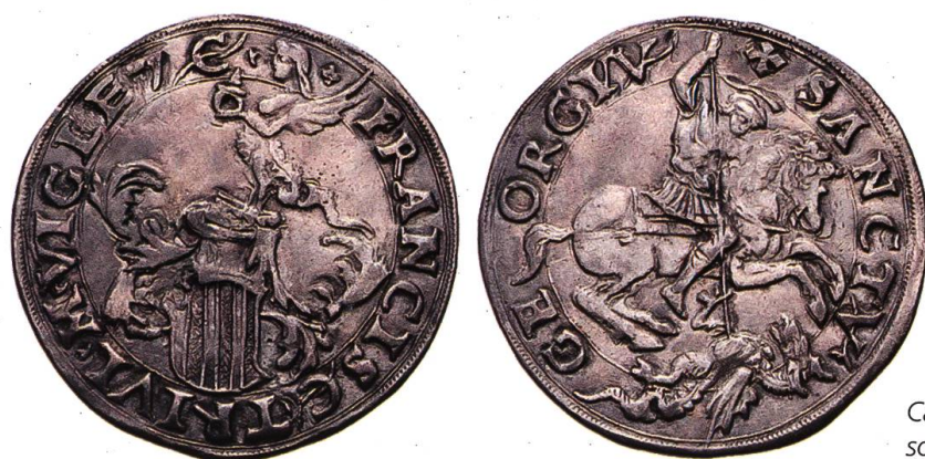
Cavallotto (argento) coniato sotto Gian Francesco Trivulzio

Ricorderemo che la «guardia», che custodiva i conii e il libro dei conti, non era un guardiano nel senso moderno del termine. Si trattava invece di un mastro esperto che doveva controllare l'assaggiatore: nell'inventario in oggetto l'estensore scrive infatti dapprima «assazatore» e poi lo cancella con un tratto di penna e corregge con «guardia». Il controllo e la stretta sorveglianza nella delicata fase degli assaggi erano importanti affinché le operazioni si svolgessero correttamente, come importante era l'attenta custodia dei libri contabili e dei cunei: 36 e proprio relativi alla contabilità devono essere i due «carimali», cioè i calamai, elencati.