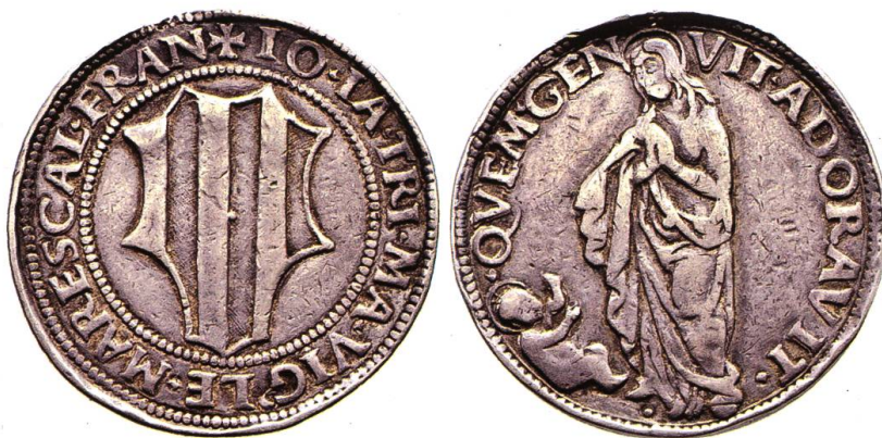
Testone (argento) coniato sotto Gian Giacomo Trivulzio