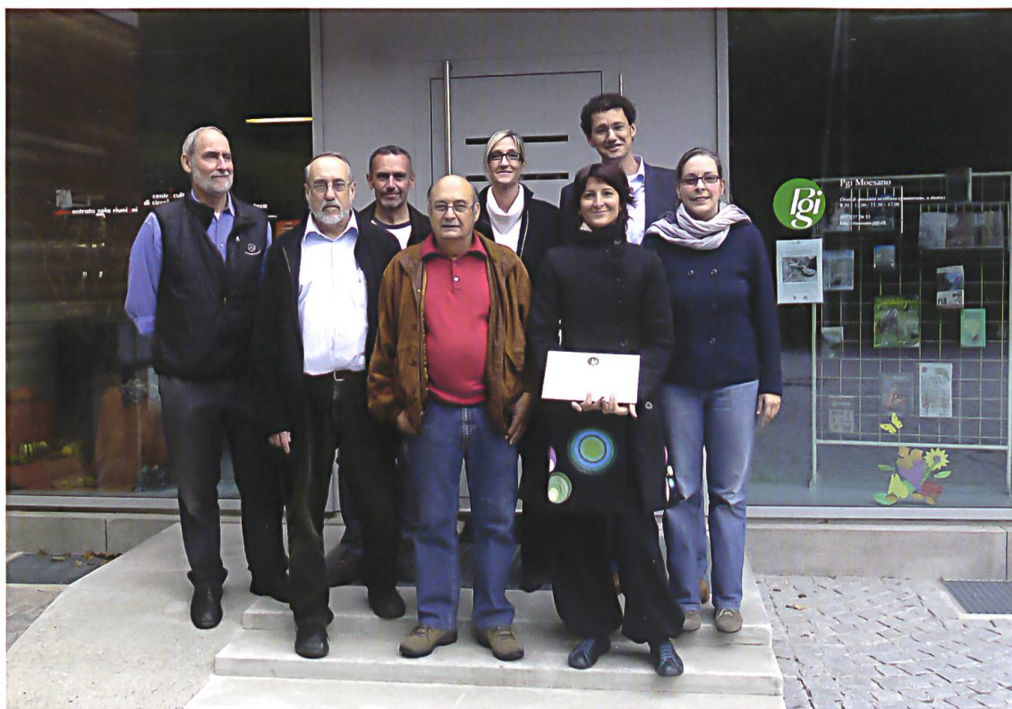
Il momento del "passaggio di consegne"

un coordinamento efficace, nonché per un potenziamento del servizio bibliotecario in Mesolcina e Calanca. Nel 1977, presso la Ca' Rossa di Grono, fu creata la "Biblioteca di studio" della sezione moesana della Pgi, che – congiuntamente alla Biblioteca popolare del Moesano con sede a Roveredo e al centro di distribuzione di Mesocco (concesso dalla Biblioteca popolare di Coira) – contribuì negli anni a stimolare e a rafforzare le attività di lettura nel tempo libero e le attività di ricerca degli studiosi. 9