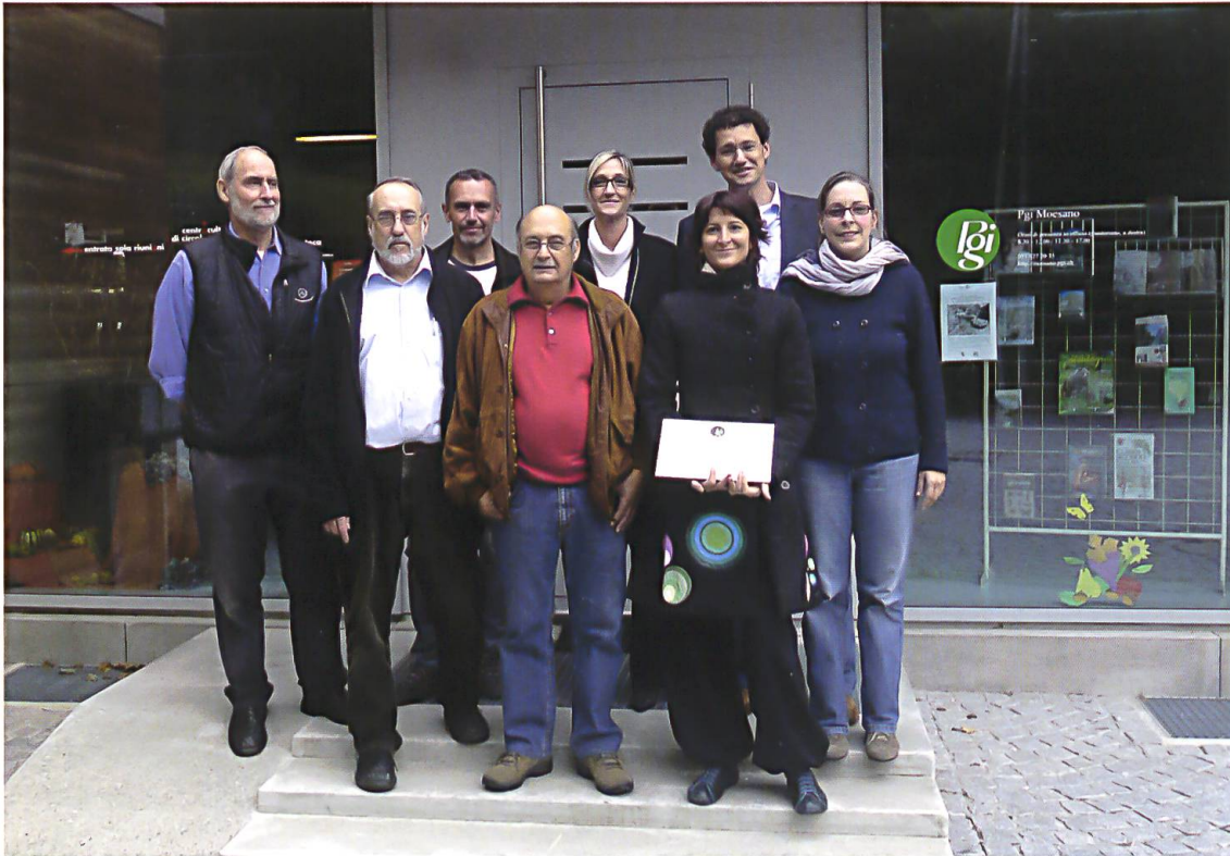
Il momento del “passaggio di consegne”

un coordinamento efficace, nonché per un potenziamento del servizio bibliotecario in Mesolcina e Calanca. Nel 1977, presso la Ca' Rossa di Grono, fu creata la “Biblioteca di studio” della sezione moesana della Pgi, che – congiuntamente alla Biblioteca popolare del Moesano con sede a Roveredo e al centro di distribuzione di Mesocco (concesso dalla Biblioteca popolare di Coira) – contribuì negli anni a stimolare e a rafforzare le attività di lettura nel tempo libero e le attività di ricerca degli studiosi. 9