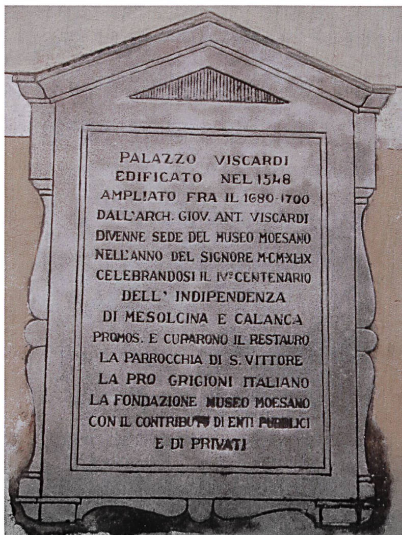
L'iscrizione posta sulla facciata di Palazzo Viscardi.

dopo anno, appena si liberava una stanza, il museo ne prese possesso per aumentare gli spazi espositivi e poter meglio esporre i beni ricevuti o acquistati nel frattempo: attrezzi d'uso quotidiano, per esempio per la lavorazione della canapa e del lino o per la bottega del falegname, arredamenti e utensili da cucina, mobili, armi, abiti da cerimonia, uniformi della milizia, paramenti e arredi sacri, ecc.