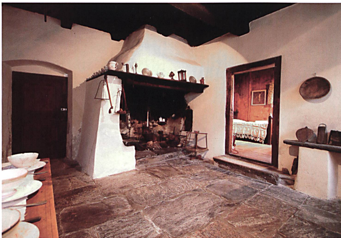
La tipica cucina mesolcinese.

stato possibile dare spazio nel museo anche a questo importante aspetto del nostro passato. La sezione archeologica, che oggi si presenta con una veste moderna, è arricchita da un laboratorio sperimentale-didattico che è stato in gran parte finanziato dall'Ufficio federale delle strade e da altri sostenitori.