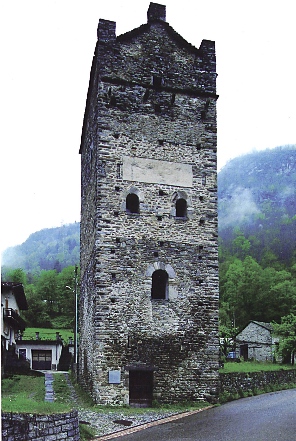
La Torre Fiorenzana a Grono.