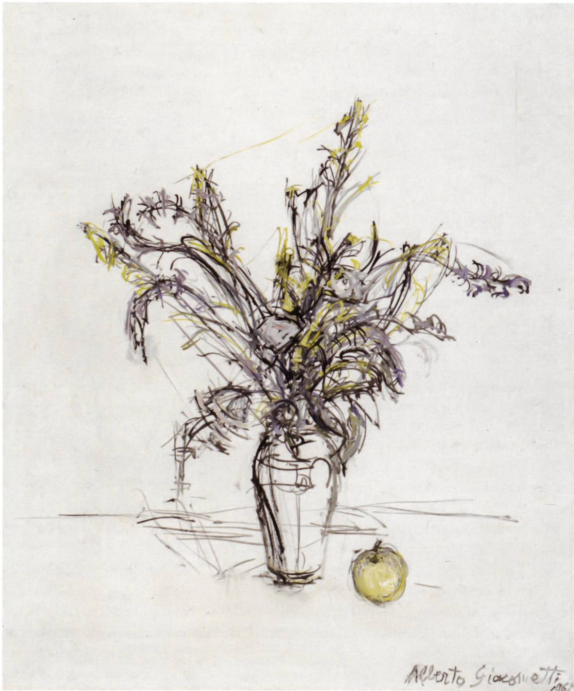
Mazzo di fiori e mela, 1961

Olio su tela (54 x 45,5 x 1,8 cm), collezione privata