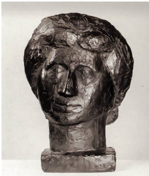
La madre dell'artista, 1927 Bronzo (32,5 x 23,3 x 12,2 cm), Kunsthaus Zürich

In una serie di teste scolpite del padre e della madre Alberto si pone gli interrogativi di base della rappresentazione scultorea, sospesa tra la riproduzione mimetica della realtà e la riduzione formale per astrazione stereometrica. La scultura intitolata La madre dell'artista , del 1927, rivela la formulazione fondamentale, presieduta dai pervasivi problemi del processo visivo. La tecnica plastica si traduce in una scultura stretta, discoidale, che restituisce solo in modo illusorio il volume del capo.