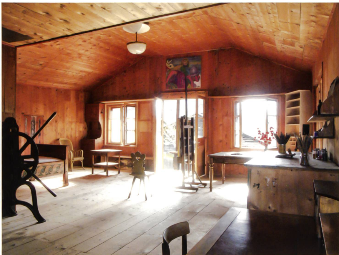
L'atelier di Giovanni e Alberto Giacometti a Stampa Fotografia 2016

Accanto al rapporto tra vita e lavoro, anche l'interazione tra spazio ed arte gioca un ruolo fondamentale. Il povero spazio di lavoro di Giacometti a Parigi, quella « condition misérable », rileva un contrasto evidente con l'atelier di Stampa, che dà un'impressione quasi borghese.