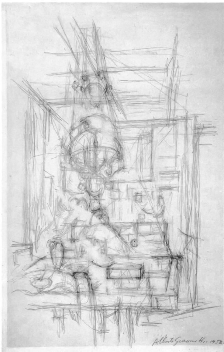
Lampada nel soggiorno ( stüa ) a Stampa, 1958 Matita su carta velina spessa (50,2 x 30,8 cm), Kunstmuseum Bern

Quando, nel 1921, Alberto si reca in visita dal prozio Antonio a Roma, realizza il bellissimo ritratto di Ada, sua cugina di secondo grado, raffigurandola seduta su una poltrona gialla, con una postura leggermente inclinata. La figura a tre quarti, che occupa quasi tutto il ritratto, è poggiata con nonchalance ai braccioli della poltrona, mentre la mimica suggerisce lo sforzo della modella; la camicetta di colore rosa pallido contrasta con il giallo intenso delle poltrone, l'azzurro con il rosso intenso dello sfondo. Il tratto movimentato intesse il soggetto e lo dinamizza.