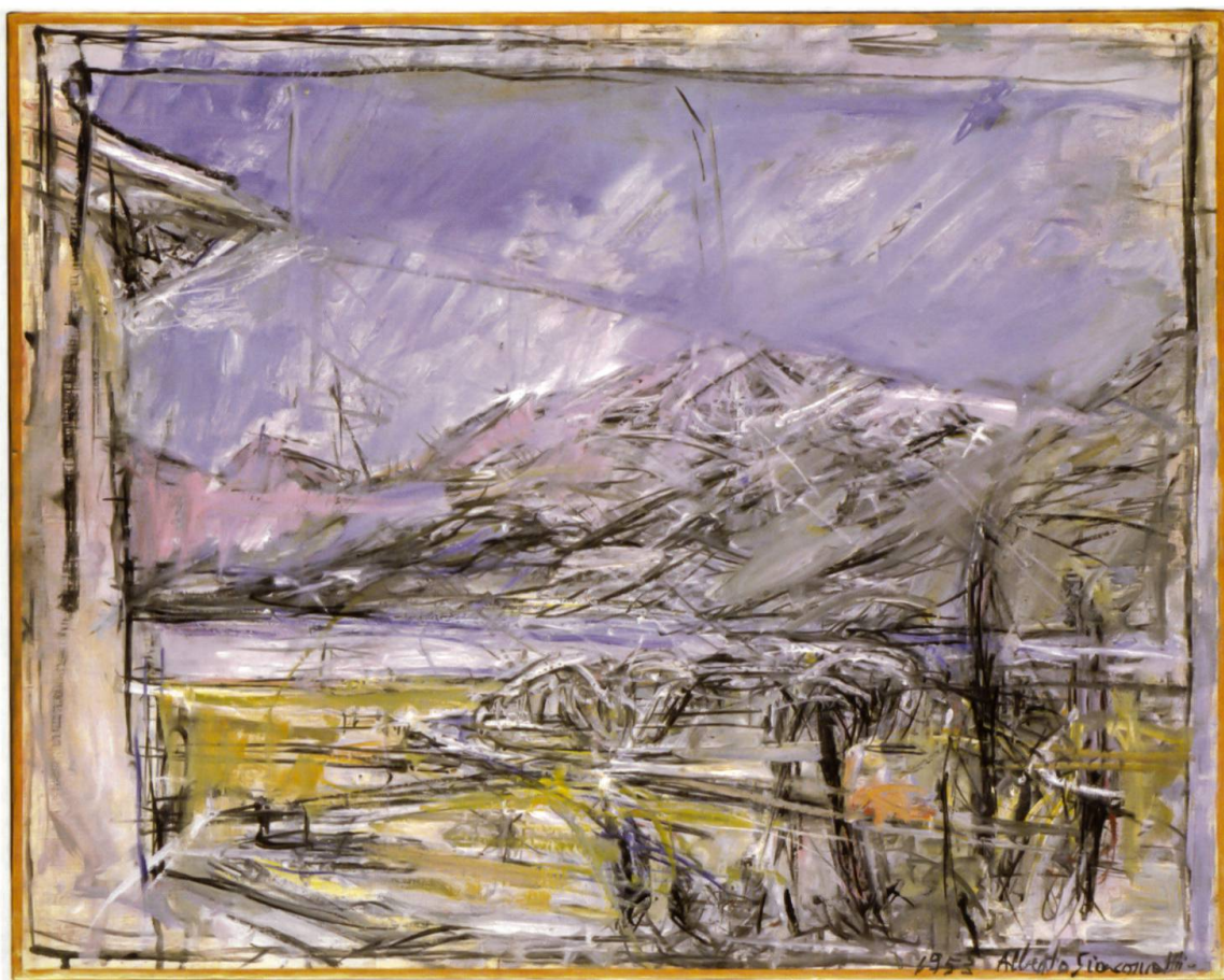
Paesaggio a Maloja, 1953 Olio su tela (46 x 55 cm), collezione privata

decise, si differenziano nella struttura del motivo e nella densità atmosferica dal modello paterno, superandolo.