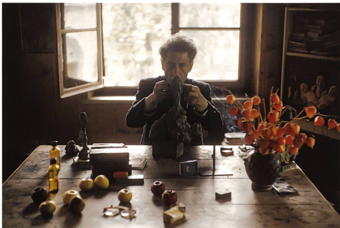
Alberto Giacometti modella un busto nell'atelier a Stampa, 1965