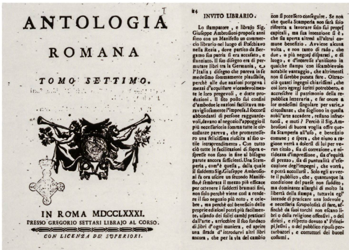
Il frontespizio dell'«Antologia romana» (tomo VII – 1781) e l'«Invito librario» nel numero 3 del luglio 1780