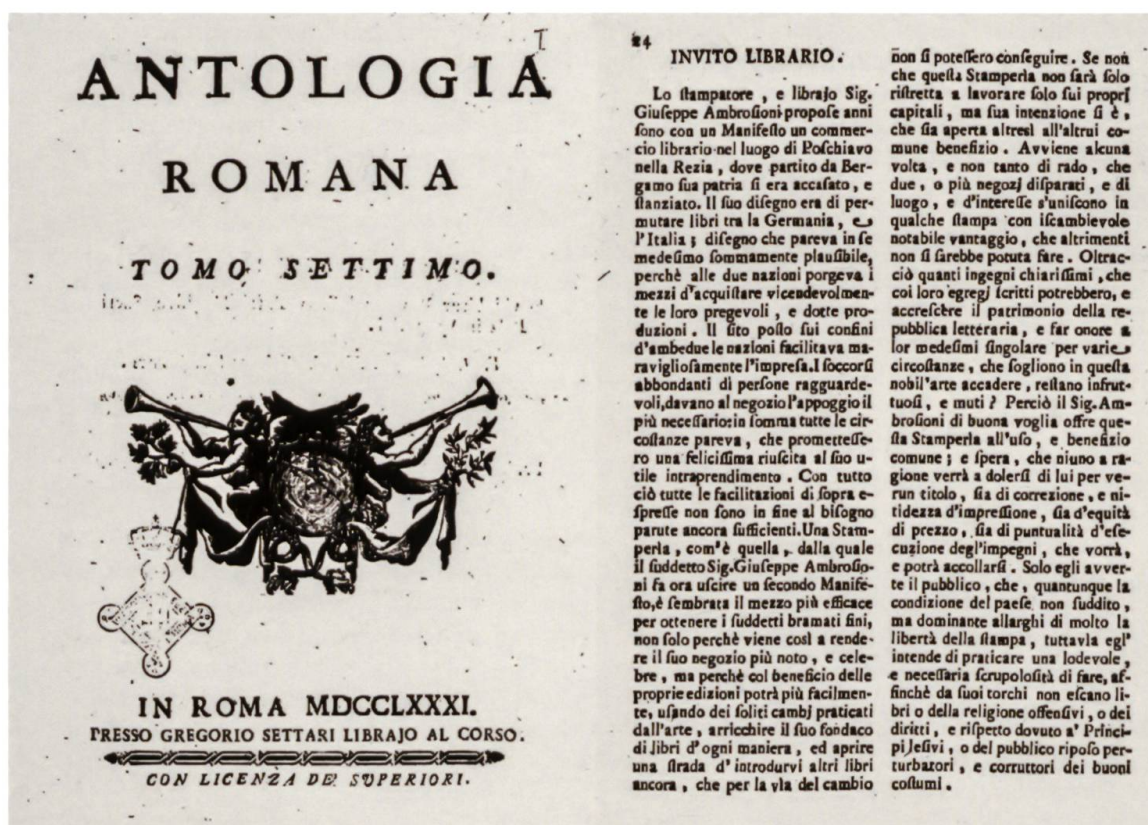
Il frontespizio dell'«Antologia romana» (tomo VII – 1781) e l'«Invito librario» nel numero 3 del luglio 1780