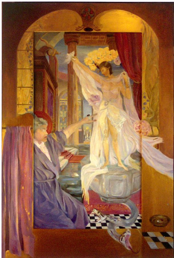
Anna Galanga, Noli me tangere , olio su tela e pioppo, 117 x 172 cm

Oltre la siepe di bosso, nel giardino dei trifogli e del tarassaco, dove il vento tesse le sue carezzevoli reti, salmodiando un breviario di canti e preghiere sommesse, veglia ancora un’esile fanciulla inguainata di trine, mentre ampie falde le coprono il volto pudico. Silente ed assorta, volge gli occhi alle stelle, poi sottocchi s’insinua tra le pieghe di una luna evanescente, colta da cupa vertigine che trasmuta il suo corpo di luce, mentre intinge la mano nel rosso carminio per pingersi l’umido labbro. Sulla tela: lei stessa, l’imago dell’alba nascente.