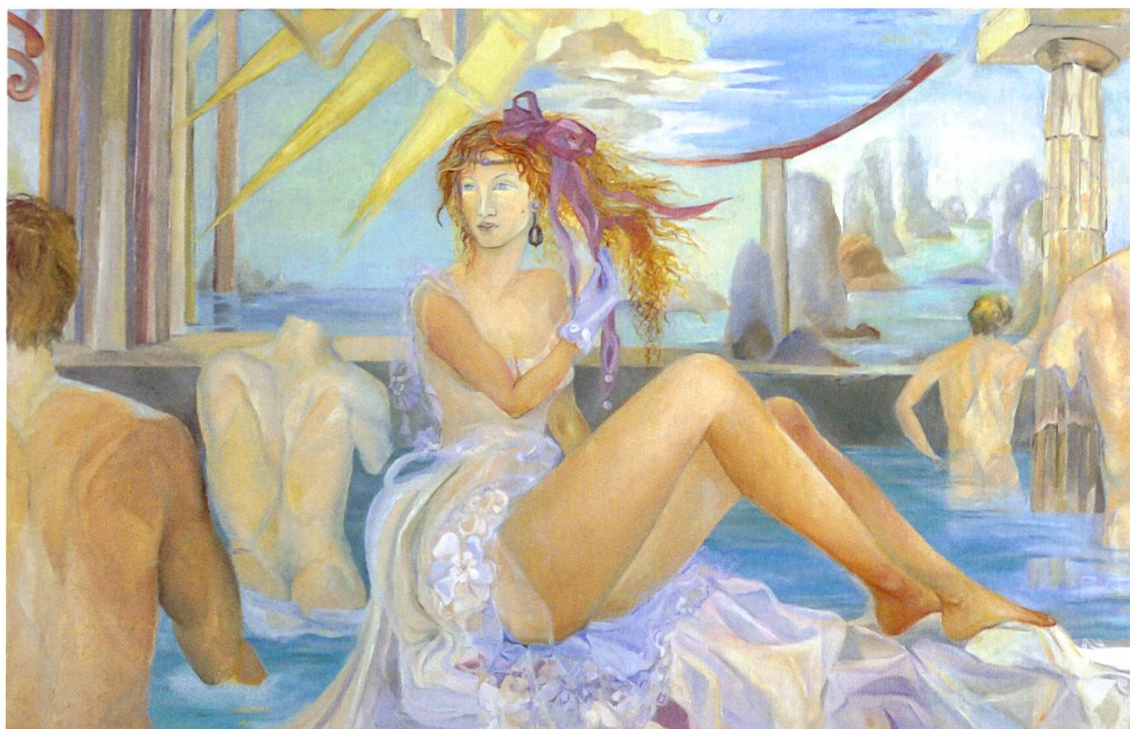
Anna Galanga, Al fiume , olio su tela, 120 x 133 cm

estati calde e afose, dalle risate cristalline dei miei sei fratellini. Adolescente, mi sono trasferita con la famiglia nella casa materna di Viale Garibaldi a Tirano (So), dove, con maggior consapevolezza, mi sono lasciata trasportare nel mondo dell'arte dall'esempio del nonno materno, stimato decoratore di finissimi fregi, grottesche, cartigli, trompe-l'oeil ed emblematiche meridiane.