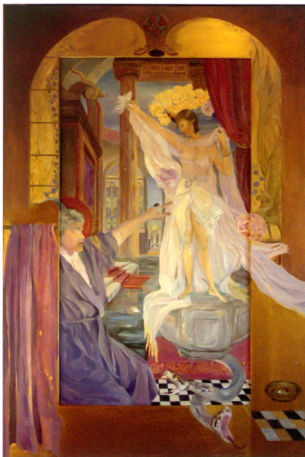
Anna Galanga, Noli me tangere , olio su tela e pioppo, 117 x 172 cm

Oltre la siepe di bosso, nel giardino dei trifogli e del tarassaco, dove il vento tesse le sue carezzevoli reti, salmodiando un breviario di canti e preghiere sommesse, veglia ancora un’esile fanciulla inguainata di trine, mentre ampie falde le coprono il volto pudico. Silente ed assorta, volge gli occhi alle stelle, poi sottocchi s’insinua tra le pieghe di una luna evanescente, colta da cupa vertigine che trasmuta il suo corpo di luce, mentre intinge la mano nel rosso carminio per pingersi l’umido labbro. Sulla tela: lei stessa, l’imago dell’alba nascente.