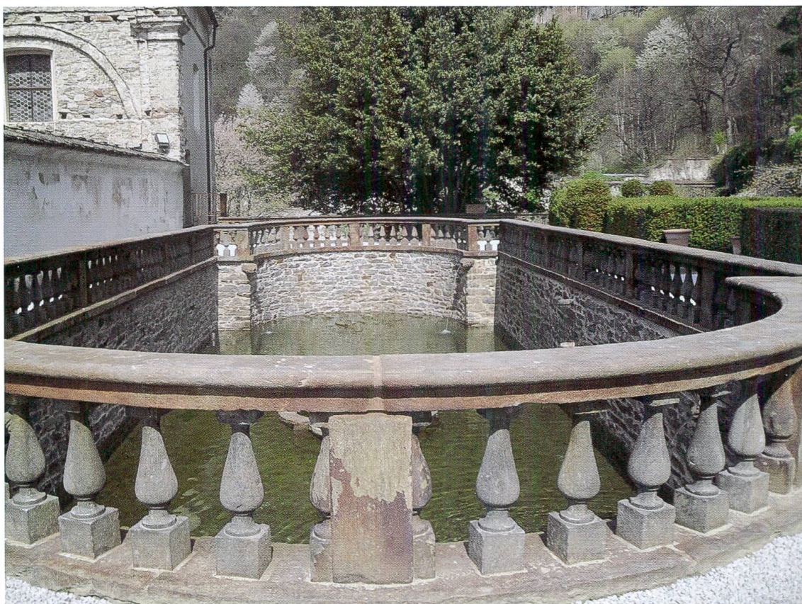
Particolare della peschiera, dove recentemente è tornata l'acqua. (Foto 7)