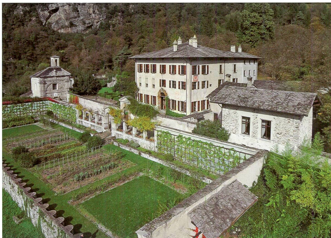
Palazzo Vertemate Franchi, l'orto oggi. (Foto 5)

Il vigneto digrada in leggero pendio verso il muraglione di cinta costituito da massi anche di notevoli dimensioni, mentre grandi pergole salivano un tempo anche verso l'interno del muro di cinta a scarpa.