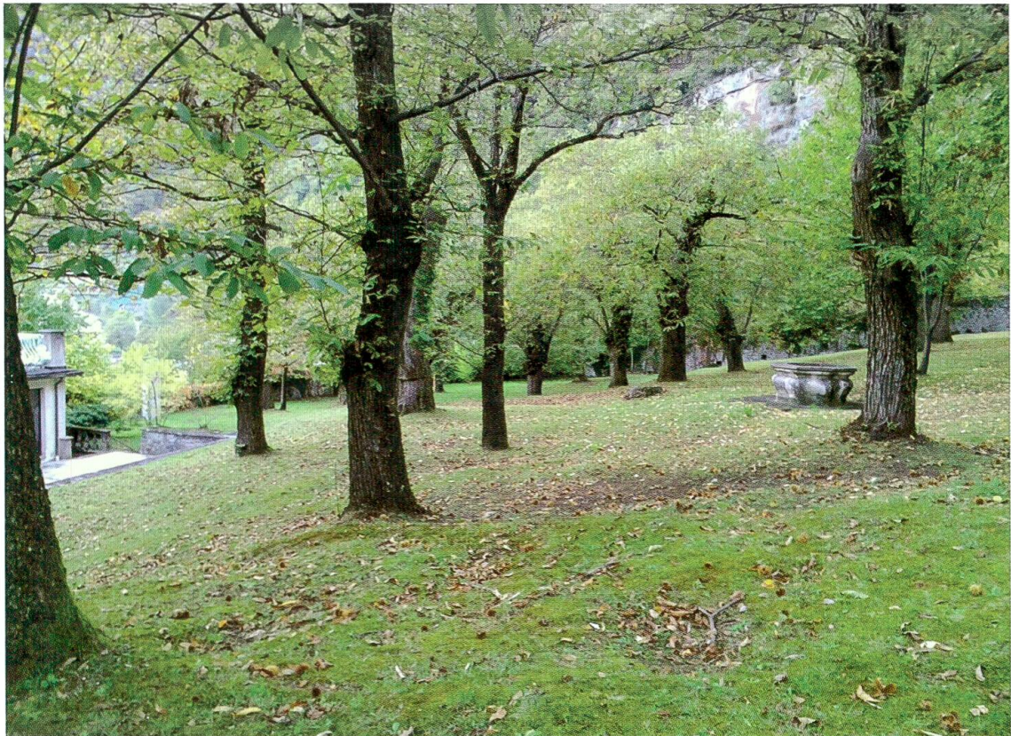
Scorcio del castagneto alle spalle del palazzo. (Foto 9)

La maggior parte dell'area orientale a cielo aperto è occupata dal castagneto, che si estende lungo il terreno in salita alle spalle del palazzo (foto 9). Pochi frutti, come