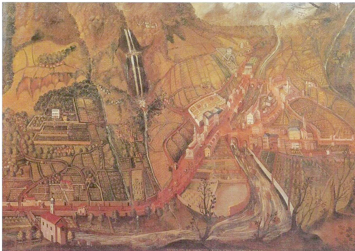
Palazzo Vertemate Franchi, Piuro prima della frana del 1618, ricostruito qualche decennio dopo in un dipinto a olio su tela. (Foto 1)

Anche lo storico grigione Johann Guler von Weineck, pubblicando il suo Raetia a Zurigo nel 1616, cita, tra le famiglie piurasche, solo i Vertemate e tra essi i fratelli che fecero costruire il palazzo, cioè “Guglielmo e Luigi, che ricoprono le cariche più im-