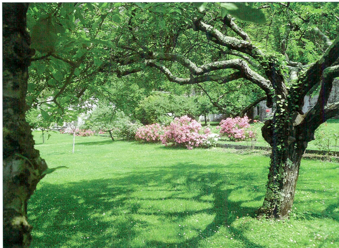
Particolare del frutteto. (Foto 8)