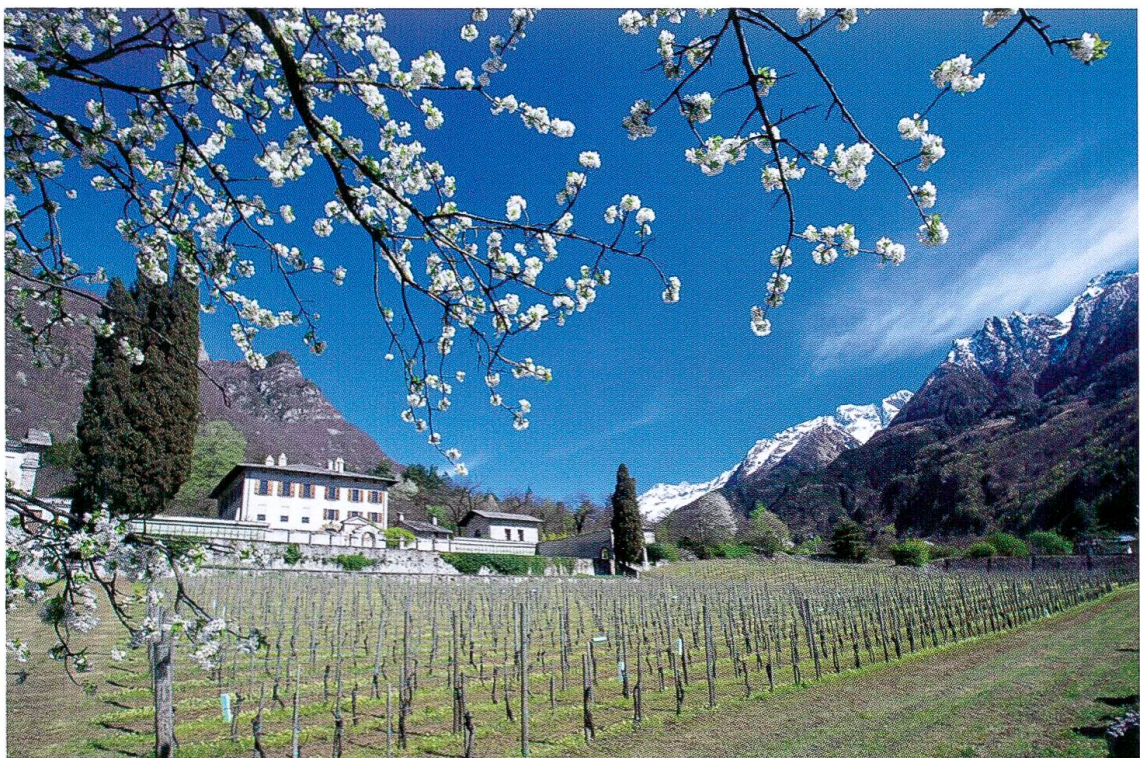
Palazzo Vertemate Franchi, il vigneto oggi. (Foto 4)

A convincere del fatto che non si trattava di una villa di piacere, ma di un'abitazione permanente restano i terreni agricoli. Innanzi tutto – cominciando da quello a quota più bassa, verso Chiavenna per intenderci – si incontra il grande vigneto rettangolare che si estende per la massima lunghezza da nord a sud. E certo il vino