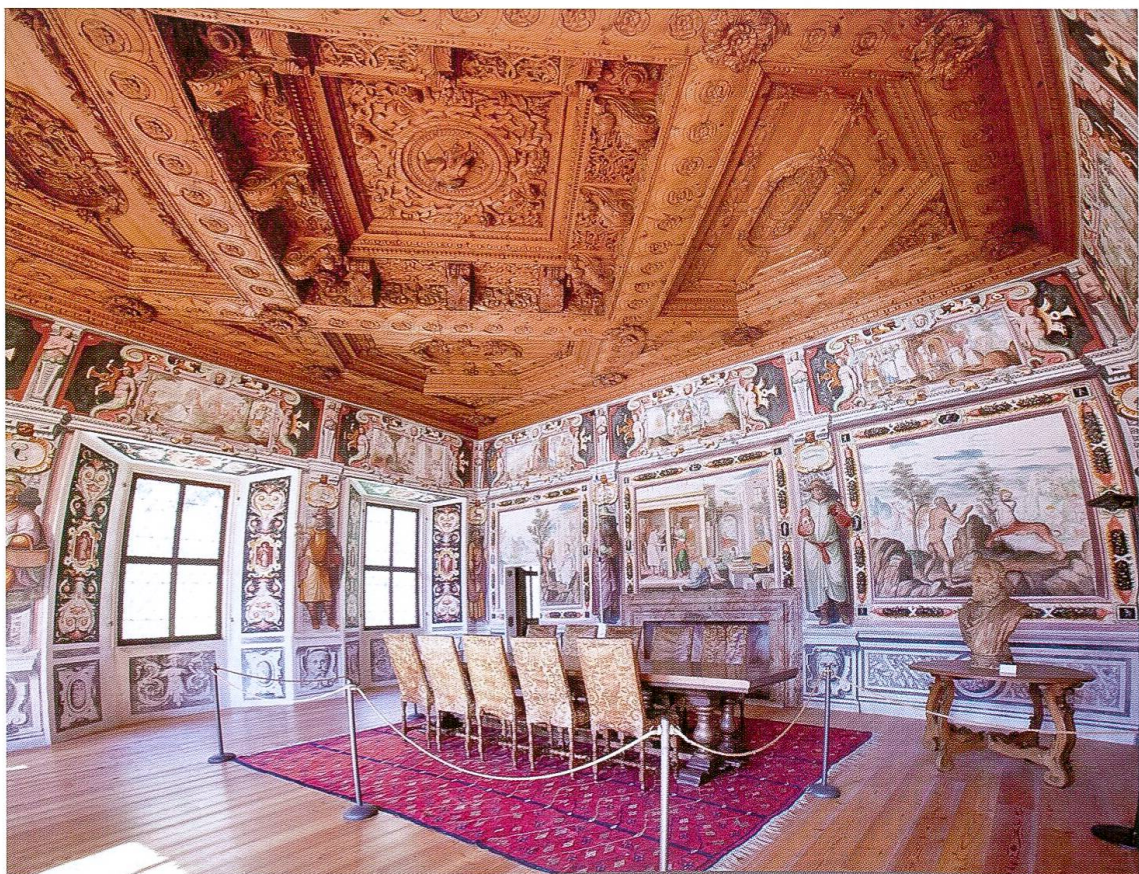
Palazzo Vertemate Franchi, particolare del Salone dello Zodiaco. (Foto 2)

Il Vertemate Franchi esiste tuttora perché non fu travolto dalla frana essendo distante oltre un chilometro, in una località già indicata come Roncaglia, che si estendeva lun-