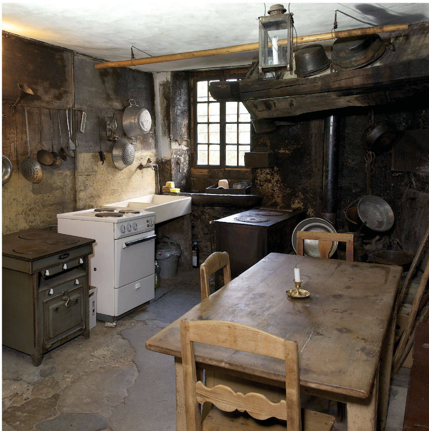
La cucina, testimone dell'evoluzione del tempo

maniere e il timor di Dio. Soprattutto insegna loro che lo scopo dell'esistenza dei figli è quello di aiutare e assistere i genitori. Le ragazze, che non vengono mai incoraggiate a sposarsi, crescono nella convinzione che il loro compito sia quello di occuparsi della casa e di accudirsi a vicenda. Ed è effettivamente quello che fanno per tutta la vita.