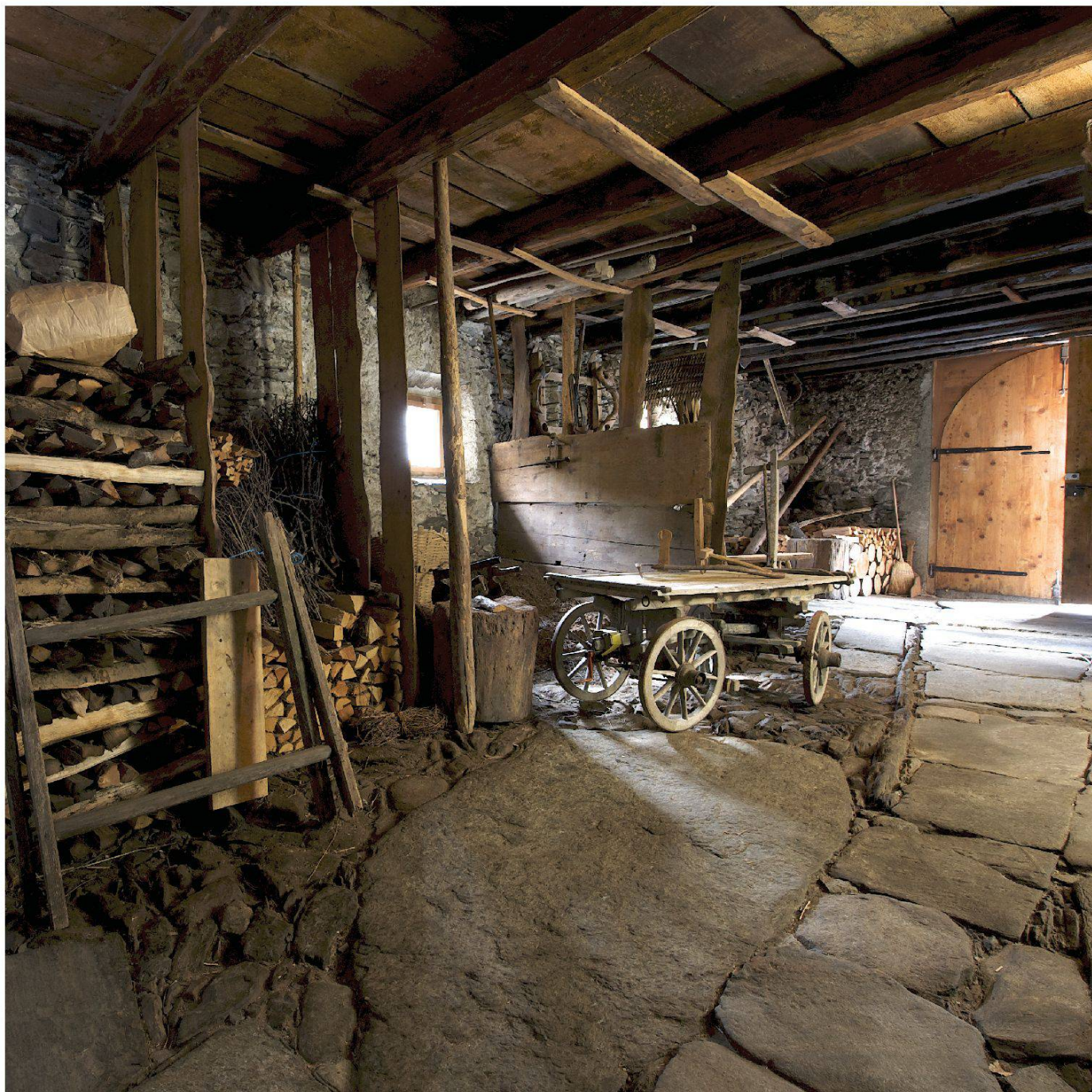
La curt, il fulcro delle attività domestiche