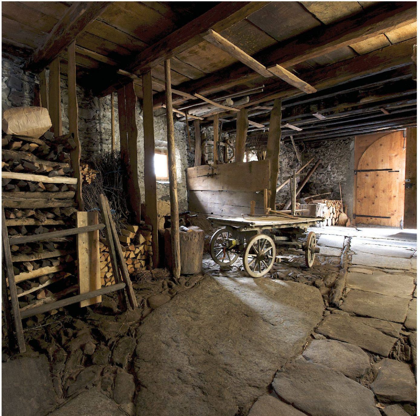
La curt, il fulcro delle attività domestiche