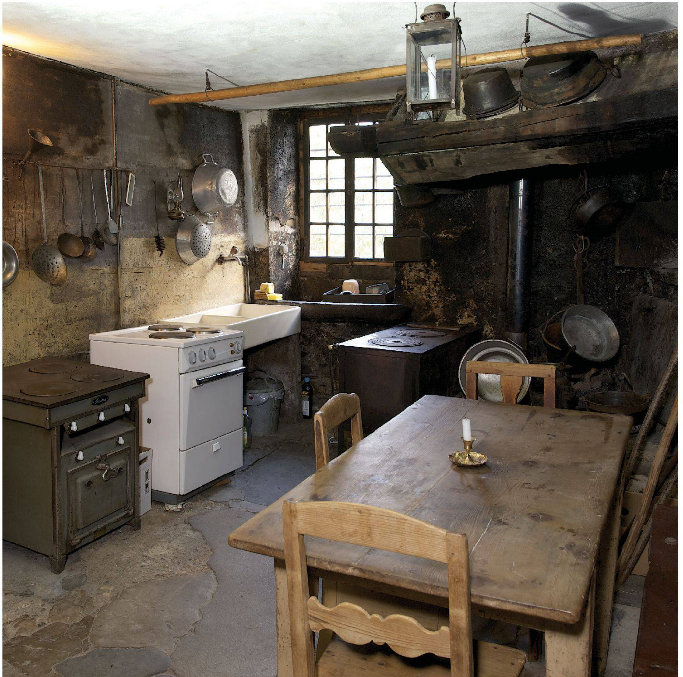
La cucina, testimone dell'evoluzione del tempo

maniere e il timor di Dio. Soprattutto insegna loro che lo scopo dell'esistenza dei figli è quello di aiutare e assistere i genitori. Le ragazze, che non vengono mai incoraggiate a sposarsi, crescono nella convinzione che il loro compito sia quello di occuparsi della casa e di accudirsi a vicenda. Ed è effettivamente quello che fanno per tutta la vita.