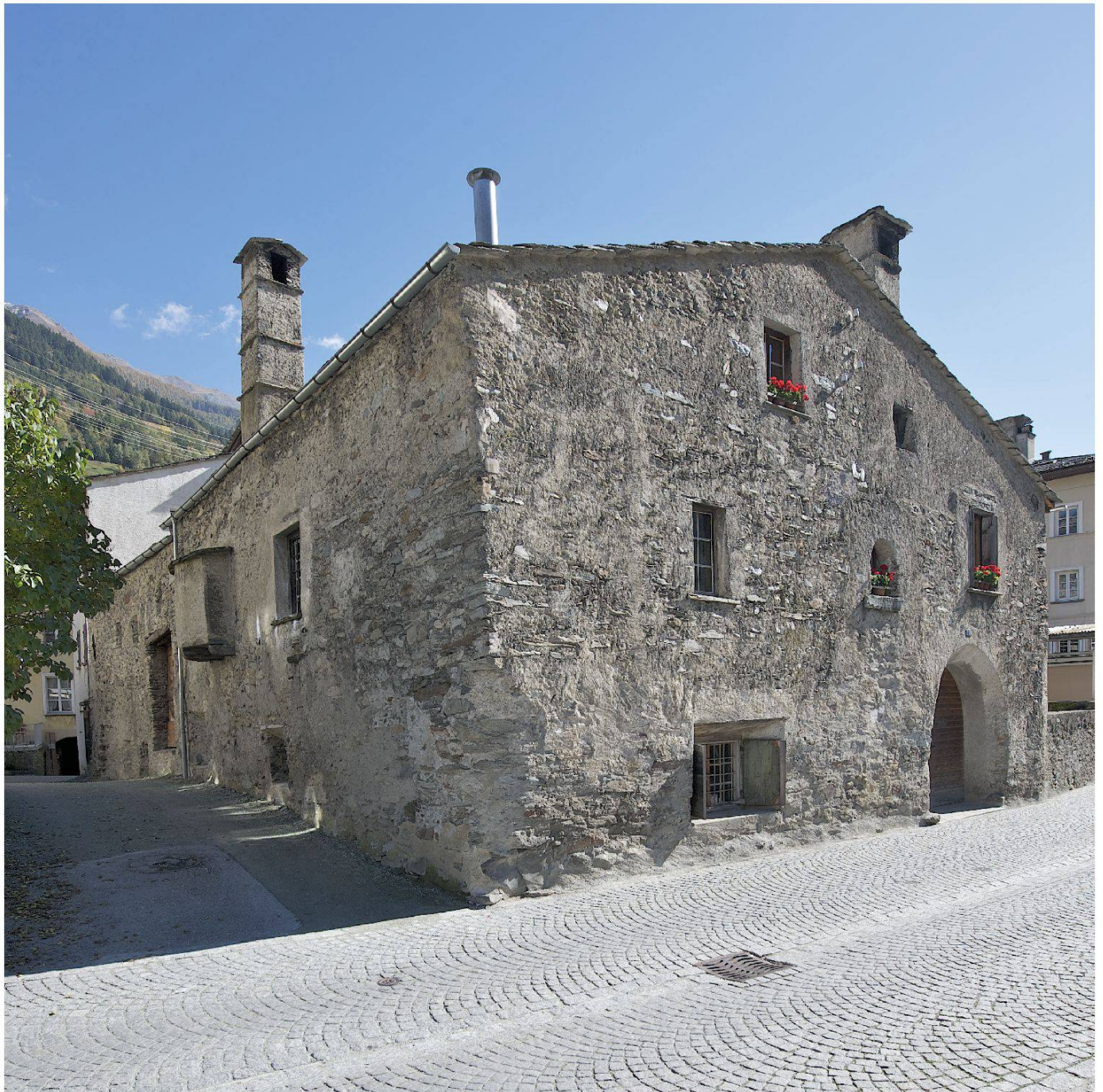
Le facciate 'parlanti' di Casa Tomé

scoprono le proprie radici. E si rivolge anche ai mediatori culturali, chiamati quotidianamente a trasmettere agli ospiti caratteristiche, curiosità, fatti ed emozioni legati a questo piccolo, sorprendente gioiello incastonato fra le vie del Borgo.