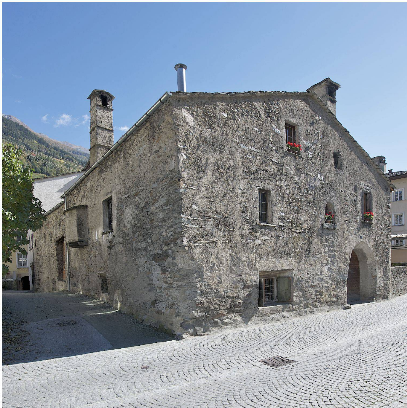
Le facciate 'parlanti' di Casa Tomé

scoprono le proprie radici. E si rivolge anche ai mediatori culturali, chiamati quotidianamente a trasmettere agli ospiti caratteristiche, curiosità, fatti ed emozioni legati a questo piccolo, sorprendente gioiello incastonato fra le vie del Borgo.