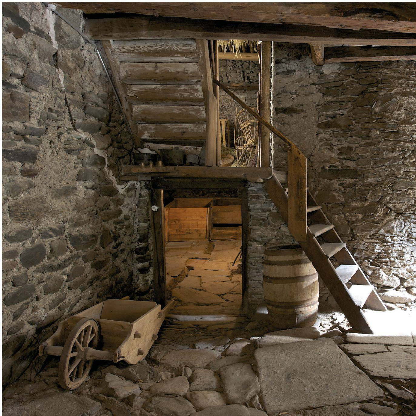
La stalla e il fienile, accessibili direttamente dalla curt

inalterato nei suoi oltre 650 anni di esistenza. Sia la costruzione sia l'arredamento, interamente conservato, sono testimoni di una civiltà rurale ormai scomparsa. Sotto la protezione dell'Ufficio dei monumenti storici del Cantone dei Grigioni dal 1993 e di proprietà della Fondazione Ente Museo Poschiavino (FEM) dal 2002, questa modesta casa in sasso a due piani con stalla e fienile annessi deve la sua sopravvivenza così com'è alla decisione di essere sottoposta a un restauro puramente conservativo: mantenere intatta quanto più possibile l'intera sostanza e l'arredamento, tenendo conto di tutte le tappe costruttive attraversate. Non sostituire, quindi, quanto danneggiato, ma ripararlo o ricostruirlo nel rispetto dei metodi costruttivi di un tempo, con materiali originali.