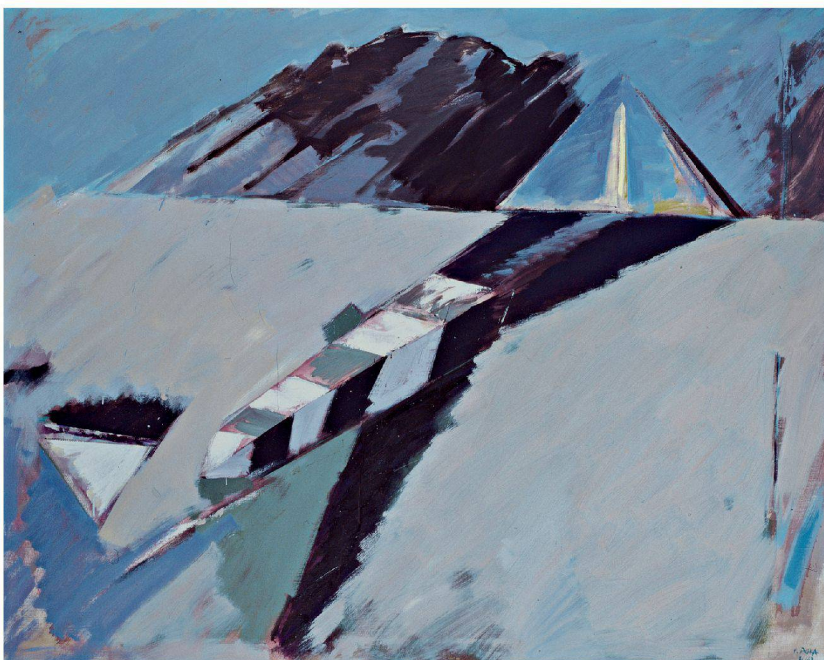
ORIZZONTI IX , 1981, olio su tela, 120x150 cm, collezione privata, Coira