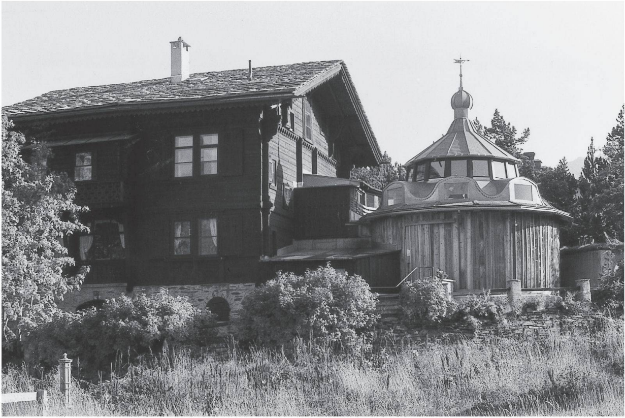
Maloggia, Casa Segantini con l'atelier

Nel periodo in cui era a bottega da Tettamanzi Giovanni Segantini iniziò a frequentare i corsi di arte a Brera, la più celebre Accademia di belle arti d'Italia. Le vicende del suo successo si susseguono; già durante il periodo di formazione egli conseguì tutta una serie di riconoscimenti. Al termine dei suoi quattro anni di Accademia l'artista realizzò nel 1879 il dipinto Il coro di Sant'Antonio , che ottenne il primo premio del principe Umberto, erede al trono d'Italia, e venne acquistato dalla Società per le belle Arti di Milano.