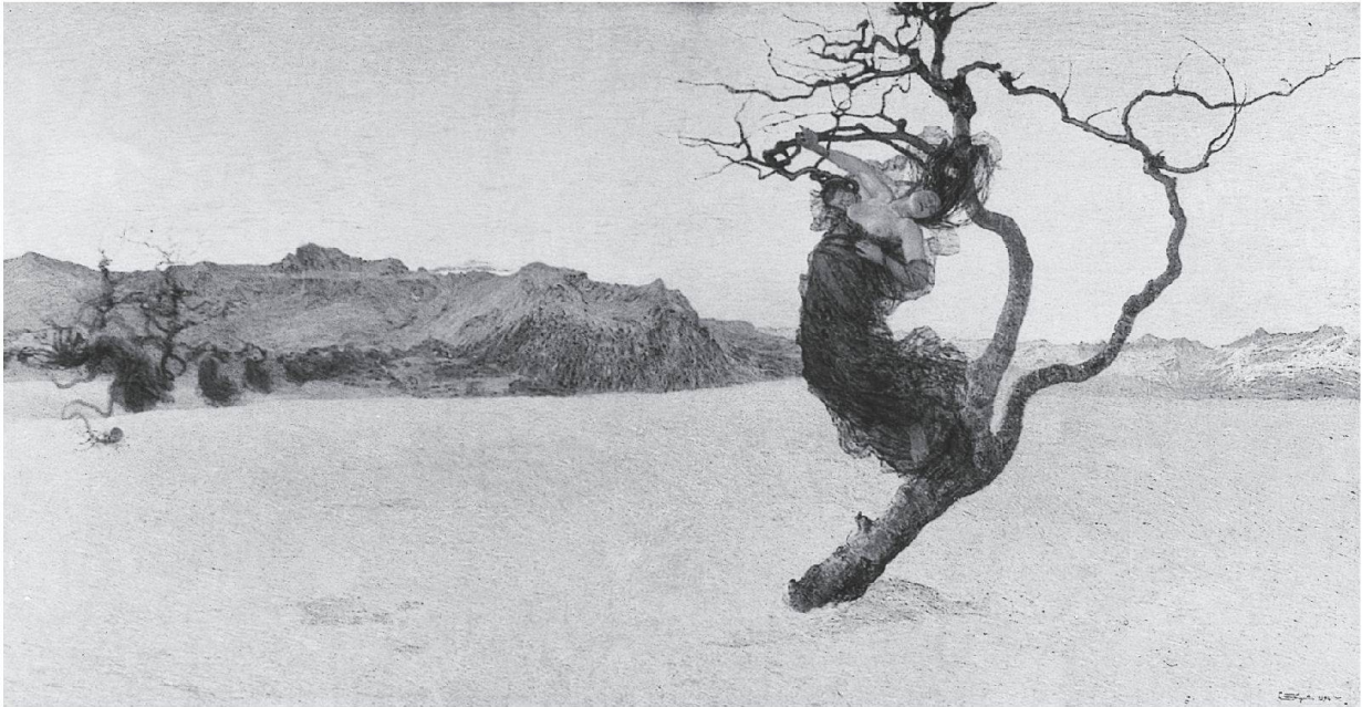
Le cattive madri, 1894. Österreichische Galerie, Wien

zata dalle ombre della sua infelice infanzia, per tornare alle vette della sua arte. I suoi motivi, quelli della sua ritrovata gioiosa rappresentazione della fonte della vita, il ritorno ai simboli della forza generatrice, sono indizi sicuri di questa risurrezione. Segantini afferma chiaramente che: “per lui è importante che la sua opera sia generata dalla viva percezione, un’opera che dovrà corrispondere appieno ai suoi ideali”. Sarà infatti l’idealizzazione – accanto al suo modo sereno e positivo di concepire la vita – uno dei pilastri del suo genio. Questo atteggiamento di fondo permette, se non di cancellare, almeno di attenuare la critica di moralismo che gli era stata mossa da più parti. Del resto se si vuole accettare e capire la sua opera è assolutamente necessario accettare anche la sua vita. Una moralità da attribuire sicuramente alla sua miserrima infanzia, poiché come tutti sanno la miseria genera valori morali, essendo il suo elemento complementare. È, questa, una legge universale per l’intera umanità. Perciò nulla si frappona a questo classico carattere vincolante di Segantini con la sua opera.