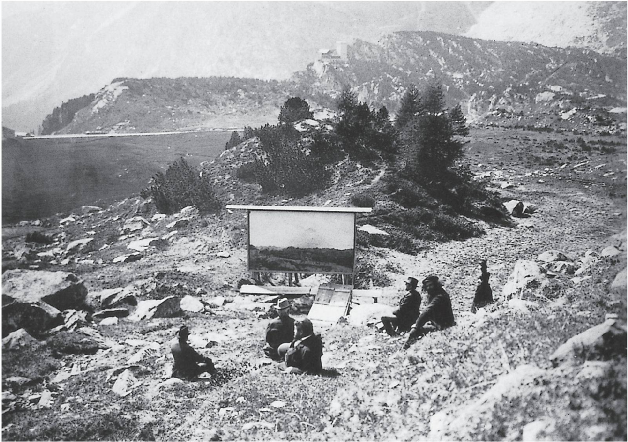
Giovanni Segantini con alcuni amici davanti al pannello centrale del Trittico, Maloja, 1898

l'uomo e l'animale nell'ambiente agreste. E allora pastori e pastorelle assurgono a simboli significativi di cura e protezione, mentre i suoi contadini si identificano perfettamente con la natura e con il loro lavoro.