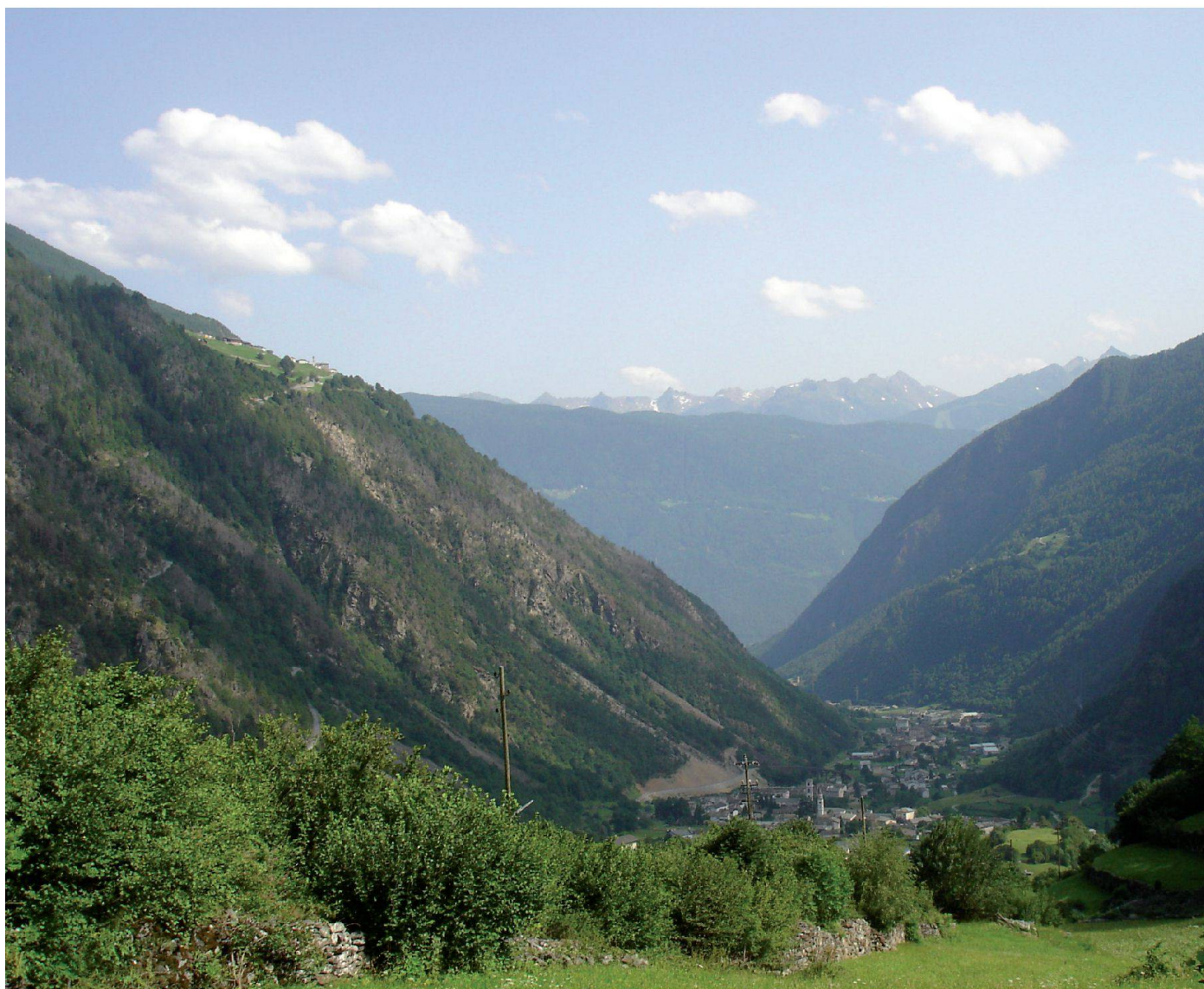
Brusio comune di confine

Dopo qualche anno la murata è finita e tutti gli abitanti di Torre Alta e di Borgoforte sono felici perché lì regna la pace, c'è cibo in abbondanza e i due governatori sono diventati amici per la pelle. Tutto questo è successo perché i governatori hanno superato il confine dell'egoismo e anche quello che avevano nella loro mente che faceva loro apparire tutti gli altri come nemici.