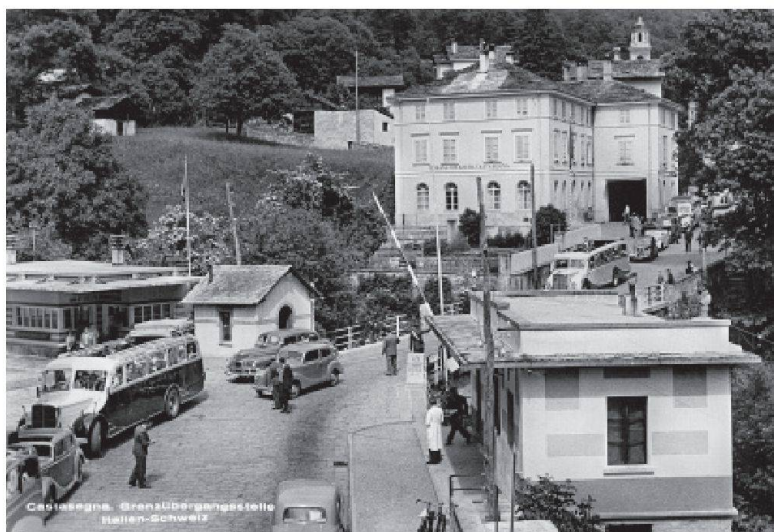
Castasegna: la dogana