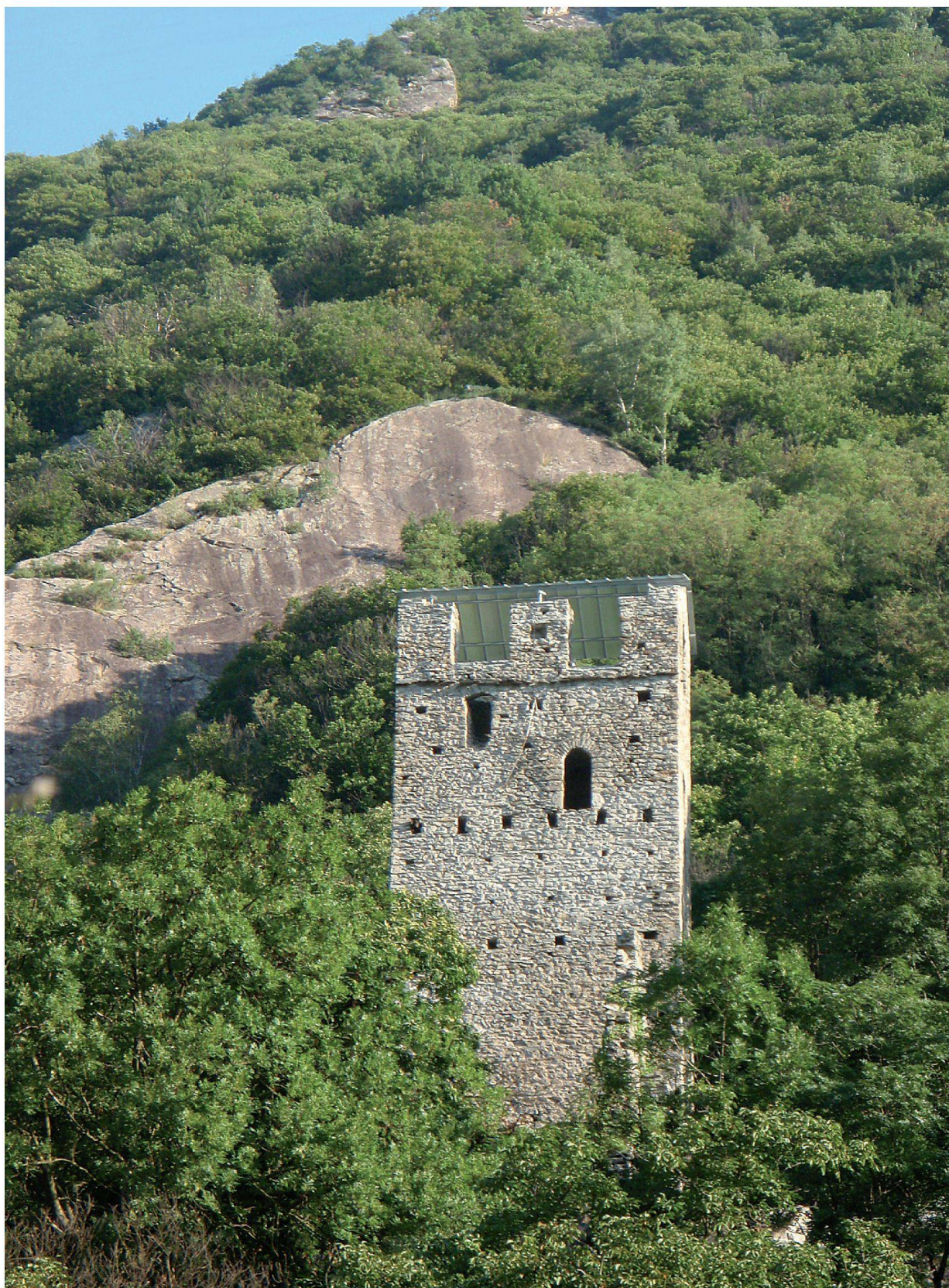
San Vittore: Torre di Pala