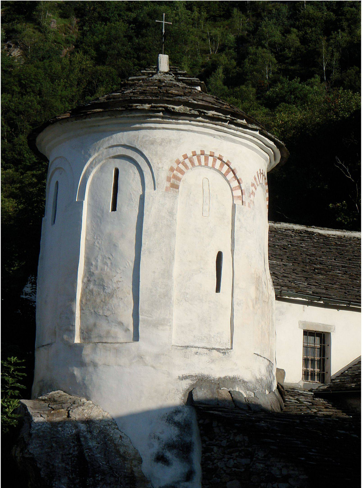
San Vittore: Rotonda di San Lucio