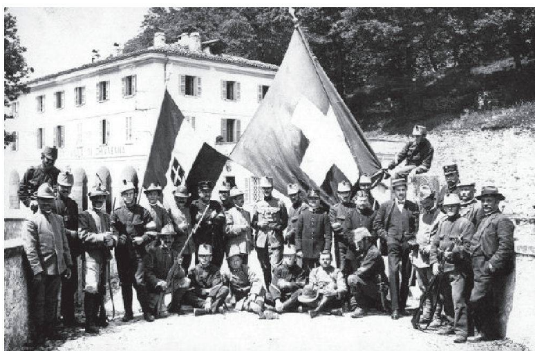
Il ponte-frontiera di Villa di Chiavenna