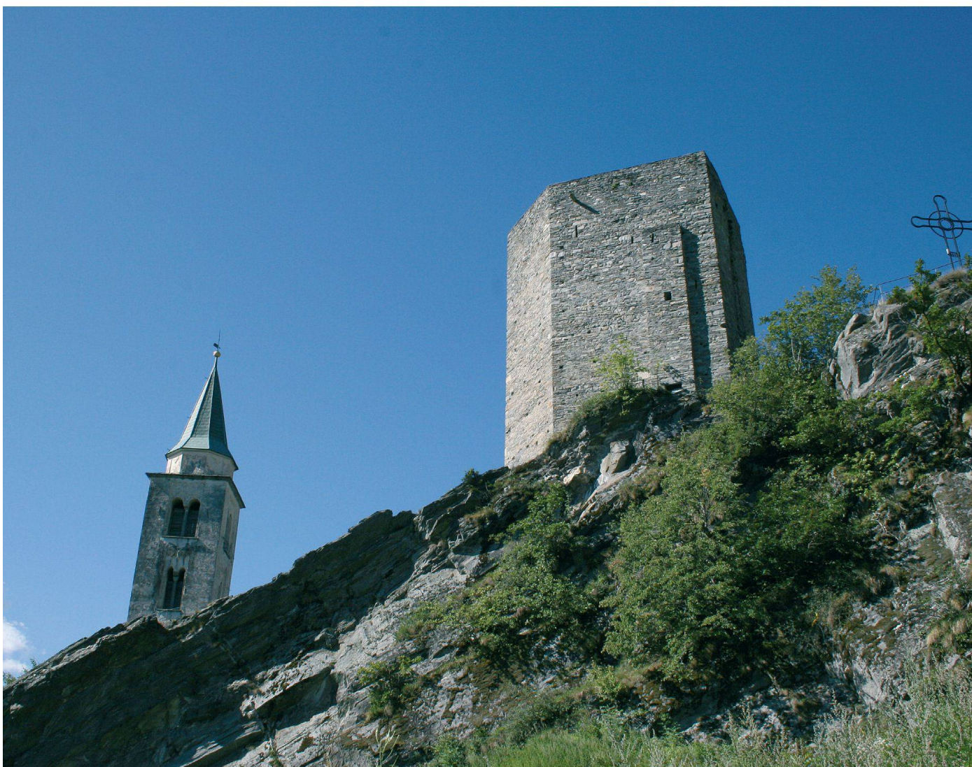
La torre di S. Maria in Calanca