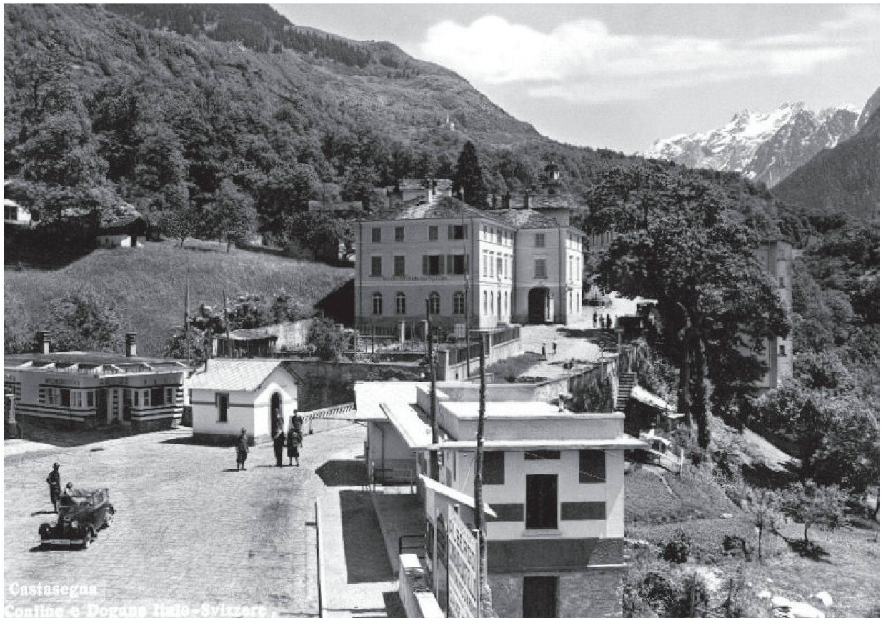
Castasegna: la dogana