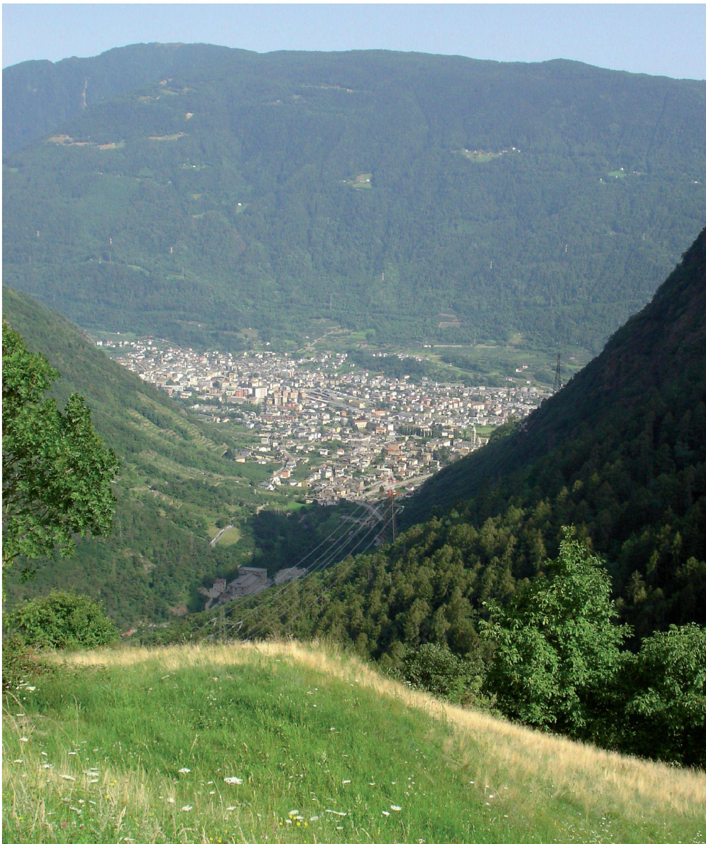
Tirano visto da Scala