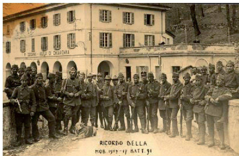
Soldati mobilitati nel 1914: davanti alla dogana di Villa di Chiavenna

"I confini non esistono", continua a dirmi quell'uomo immaginario. E superarli diventa imperativo per sopravvivere alla paura della perdita. Ora lo dico a te, sperando di fartene dono. Perché oggi, in questo tempo che è il giusto tempo solo per me, non posso che continuare a voltarmi, andando alla ricerca di una vecchia bottega dai dolci colorati, e di valigie e scarpe consunte, per non arrendermi all'idea che non sia così.