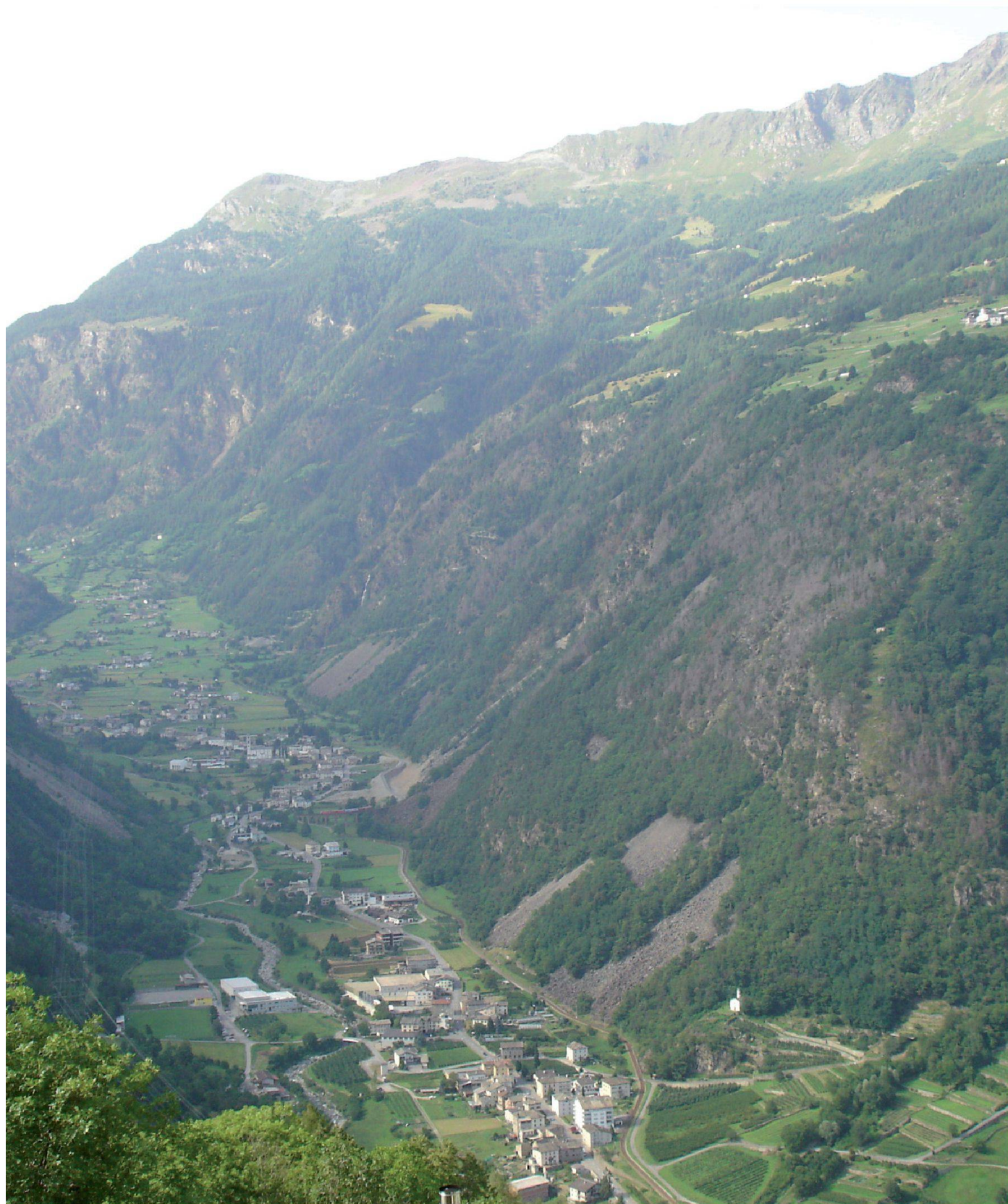
Brusio visto da Scala