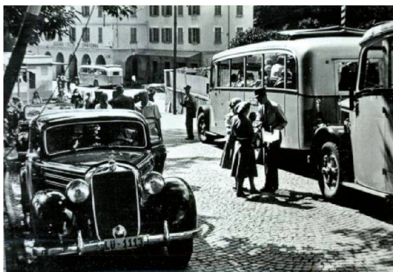
Passaggio alla dogana di Castasegna