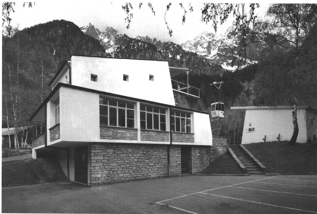
Stazione di partenza della funivia Pranzaira-Albigna.