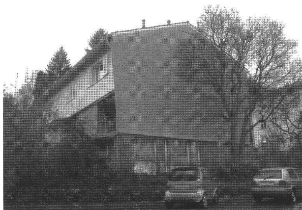
Quartiere Manegg, Zurigo, 1954-55, Bruno Giacometti.

La cooperativa edilizia HSB sviluppava quartieri nuovi molto fitti e con piante standardizzate razionali, di qualità abitativa elevata, progettando due categorie di case: l'una più efficiente sul piano edilizio ( tjockhus , con una profondità di 10-12 m), l'altra un po' più piccola ( smalhus , con una profondità di 7-10 m). La pianta prevista da Giacometti per l'insediamento Manegg – compatta, data la ristrettezza dei finanziamenti disponibili – era molto simile al tipo smalhus . Grazie a una deviazione dei volumi sul terreno e alla loro graduazione in due parti, gli edifici assumevano un orientamento quasi ottimale da est a ovest 13 . Il materiale di costruzione (mattone a vista) era piuttosto insolito in Svizzera, ma ampiamente diffuso in Scandinavia; Giacometti utilizzò un mattone particolare, relativamente a buon mercato, che rispetto alle pareti intonacate riduceva anche i costi di manutenzione. Le facciate laterali si allargavano verso l'alto per inglobare nel volume i cornicioni di gronda, ottenendo così un corpo edilizio compatto; tipologie svedesi analoghe, di uguale espressione architettonica, si riscontrano per esempio in costruzioni di Ralph Erskine (tardi anni Quaranta, anni Cinquanta) o nel complesso residenziale a Hammerby (1947-61) 14 . Si sa che Giacometti, pur non avendo mai visitato di persona quegli edifici, apprezzava molto l'architettura svedese.