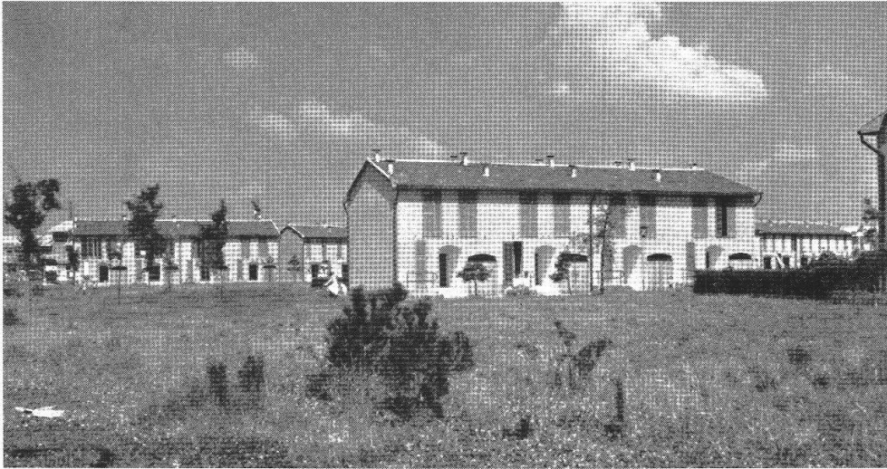
Case a schiera, Cesate, 1952, Ignazio Gardella. Giulio Carlo Argan, Ignazio Gardella, Milano 1959, p. 124.