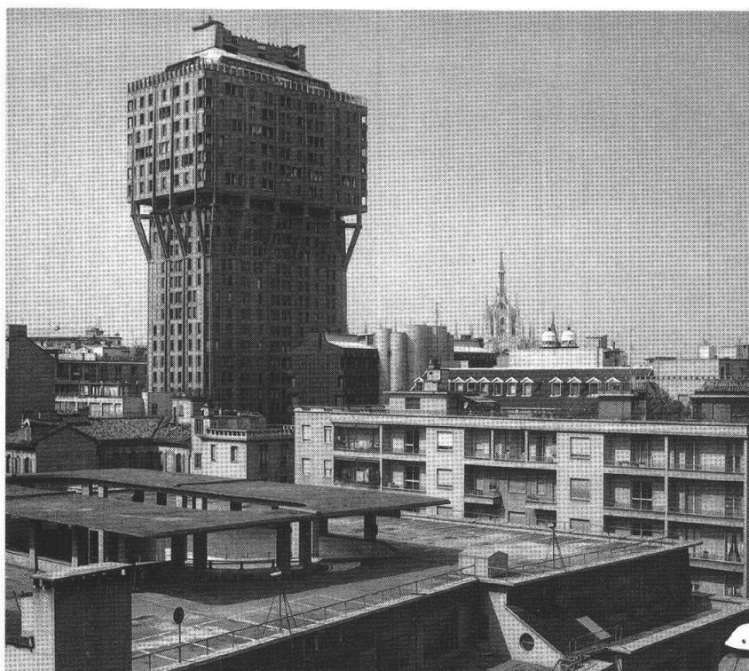
Torre Velasca, Milano, 1957-60, BBPR.

in principi già sviluppati ma continuava a progredire, anche nell'ambito del Movimento moderno. Descrivendo la Torre Velasca milanese (1957-60) 7 durante l'ultimo incontro dei Congrès Internationaux d'Architecture Moderne (CIAM) a Otterlo, in Olanda, Rogers usò parole simili a quelle impiegate per i propri edifici da Bruno Giacometti: gli aspetti in primo piano erano quelli funzionali e costruttivi. Che la Torre Velasca – in posizione centrale, vicina al duomo – si potesse interpretare anche come reazione costruttiva e formale al suo contesto storico, Rogers lo accennava sì, ma solo nell'ambito di un'argomentazione funzionale, senza situare lì lo scopo e il contenuto dell'architettura.