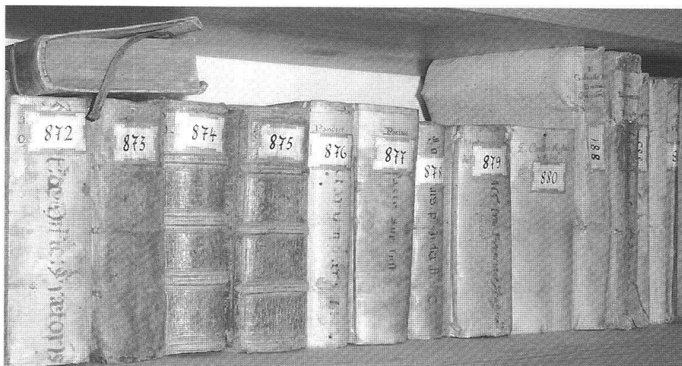
Alcuni libri del fondo librario della parrocchia di San Vittore Mauro a Poschiavo.

il mondo d'oltralpe. Tutt'altro è il caso della popolazione riformata: i libri antichi presenti nell'archivio della comunità evangelica (una cinquantina circa, perlopiù in tedesco, i più antichi del 1620), rispecchiano diligentemente il legame religioso con le Tre Leghe.