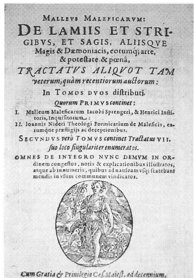
Frontespizio del Malleus maleficarum , celebre trattato contro la stregoneria, pubblicato a Francoforte nel 1556.

Presenti varie edizioni della Summa theologica di Tommaso d'Aquino (incompleta nell'edizione di Parigi del 1514, complete quelle di Venezia del 1584 e del 1596 e quella seicentesca di Lione). Da menzionare anche una preziosa edizione del De ineffabili divinitate et alia (Parigi 1512) di Giovanni Damasceno, come pure il De trinitate di Riccardo Claro (1510). Ci sono in edizioni cinquecentesche un'opera di Dionigi Certosino ( In evangelium Marci , Parigi 1543 ed altre anonime, come: Contra Alchoranum et sectam