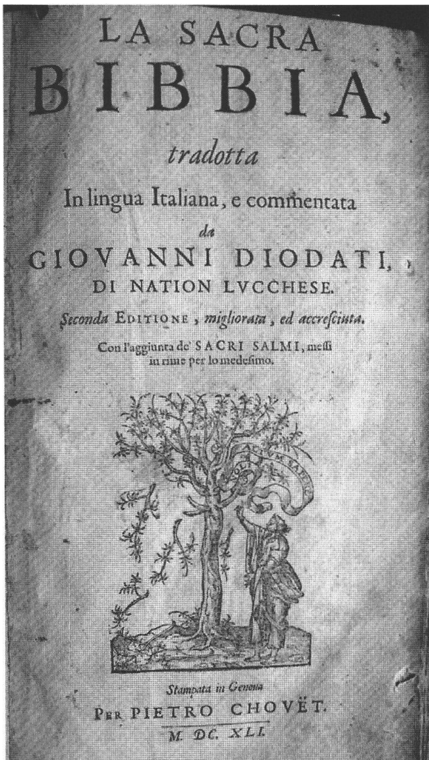
Frontespizio della seconda edizione (1641) della Bibbia di Giovanni Diodati