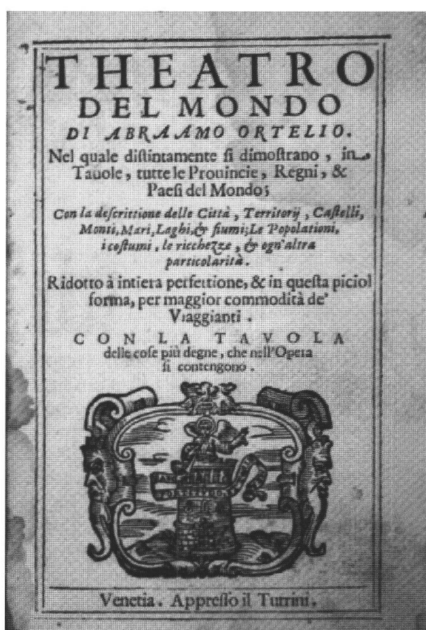
Frontespizio del Theatro del mondo di Abraamo Ortelio (1655)

italiana dei Grigioni fra XVIII e XIX secolo testimoniano anche la traduzione in italiano della Pratica di pietà del puritano inglese Luigi Bayli (Lewis Bayly), stampata a Coira nel 1710, Il cristiano nel continuo esercizio della santa orazione di Gianjacopo de Rota (Lindau 1751), le Preghiere cristiane di Nicolò Clalgüna, pastore a Soglio (Coira 1817), La devozione domestica di Otto Carisch (Coira 1853). Fra le opere in tedesco da ricordare inoltre le Geistliche Erquickstunden di Heinrich Müller, uno dei precursori del pietismo (Francoforte 1717) e Eines Christen Reisen nach der seeligen Ewigkeit del battista inglese John Bunyan (Amburgo 1752; presente anche con un'edizione italiana: Firenze 1883).