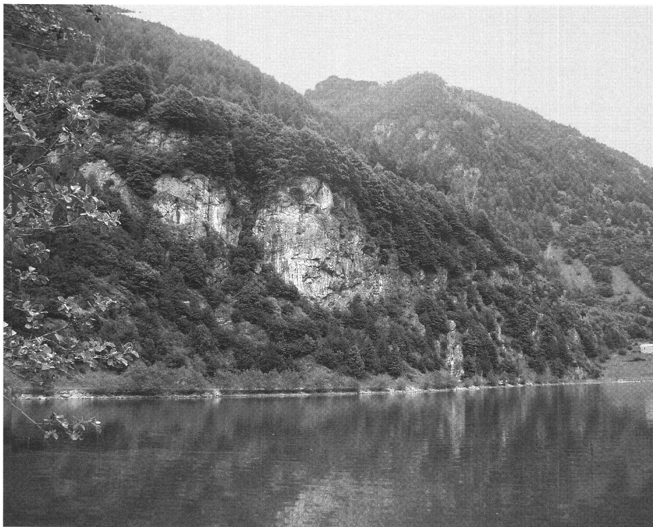
Il Bottolo con il Sass, foto di fine maggio 2003. Ai tempi in cui Achille Bassi ha composto la sua poesia, Serata di pesca al Bottolo (1953), probabilmente la vegetazione aveva un'altra configurazione. Sopra il Sass infatti c'erano campi e prati, oggi imboschiti