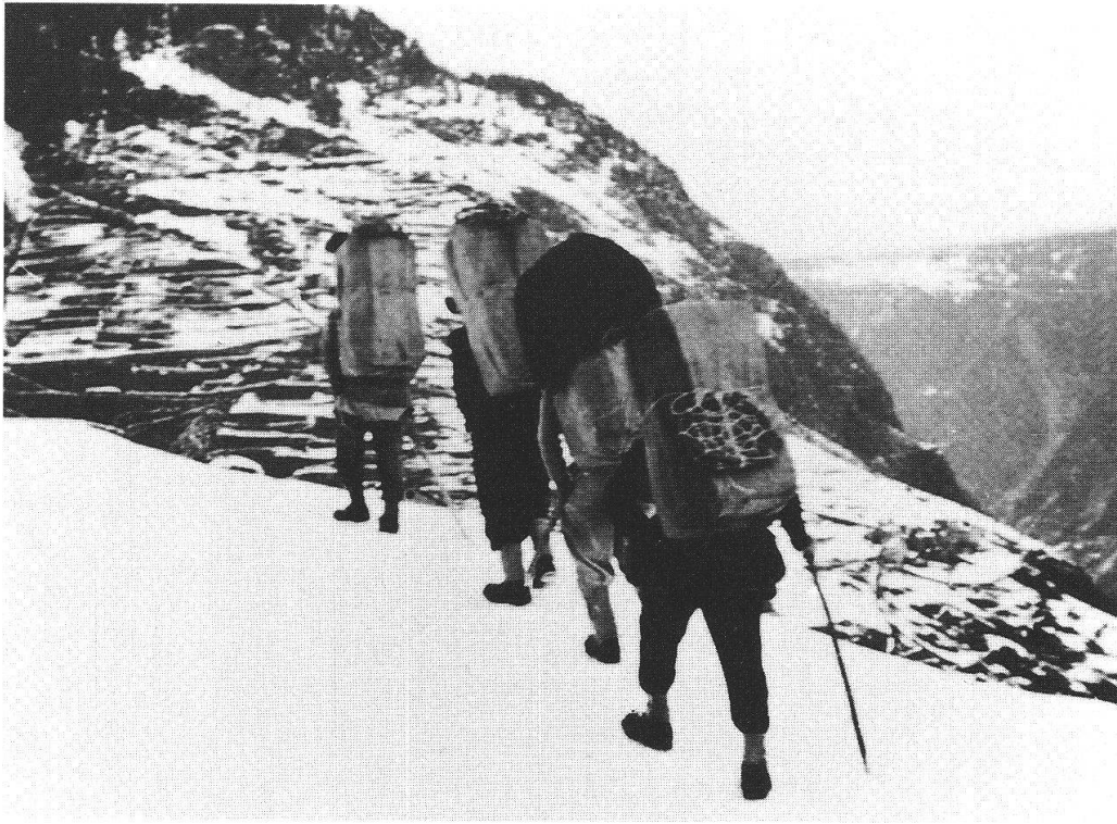
Contrabbandieri di sigarette a «La Piana»

caso – e ancora una volta riguarda la storia poschiavina dei secoli passati – del «contrabbando di libri per la divulgazione delle idee» (p. 60) o del confine – «l'ultimo confine» – tra la vita e la morte. È il caso dei confini tra i sessi, tra i ruoli. O dei limiti della morale e dei valori 10 , del discrimine – non scontato – tra illegalità e immoralità. È il caso, ancora, del “contrabbando” di qualche meretrice «intenta a piazzare la sua merce» (p. 122), dei confini imposti dal collegio («ben più severi di quelli nazionali» [p. 109]), della corrispondenza amorosa trasmessa «di frodo», delle guardie italiane che infrangono i regolamenti per potersi sposare una ragazza poschiavina, del limite oltrepassato nel bacio che Carlo dà a Marigiù 11 e di vari altri limiti e confini.