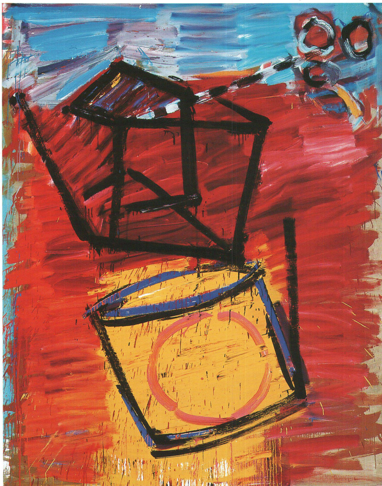
Paolo Pola, Trasformazione, 2001, olio su tela, Collezione Fedier Baden