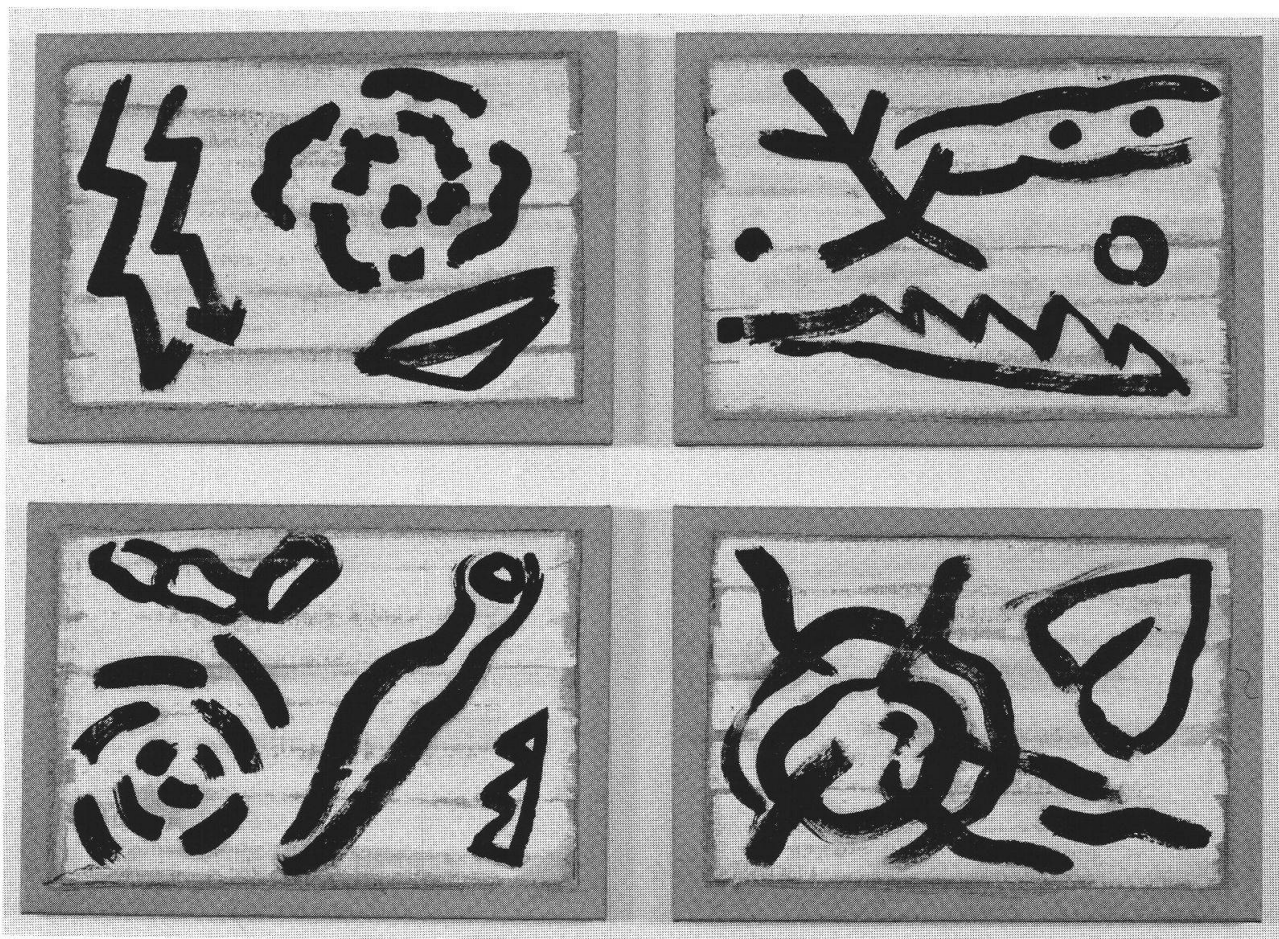
Paolo Pola, Abbreviature , 2000, acrilico e olio su tela

e colonne, è la nostalgia di un'astorica monumentalità, è una sfida alla corrosione del tempo cui resiste, appena allusa, anche la piramide, talora doppiata dall'immagine dell'obelisco, che coincide con l'idea depurata d'ogni contingenza della montagna, che è segnacolo di cielo, di terra che si libera nell'aria senza peso (e appunto Pola annota, nei suoi preziosi quaderni: "il peso della materia mi opprime; e anche: vorrei sollevarmi, svincolarmi, volare..."). Ed ecco che il concetto del volo trova un suo paradigma nella sciolta libertà gloriosa e felice della Vittoria di Samotracia, quasi amorevolmente corteggiata nel mirabile schizzo a carboncino e tempera su carta da pacco, della Figura alata (1974): dove quasi di proposito la povertà materica del supporto si trasforma in etereo slancio, aggiungendo al repertorio mentale dell'artista una nota che continuerà a riecheggiare in tutta la sua successiva opera.