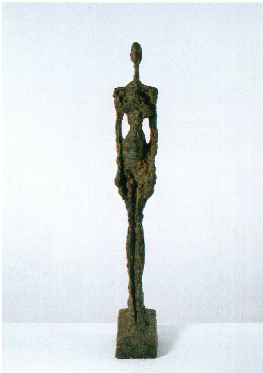
Donna di Venezia I, 1956, Kunstmuseum Bern

di vivere di me, di nutrirmi di roccia e rinchiudermi nel mio gusico e in quel buio esplorare la vita e viverla tutta d'un fiato finalmente.