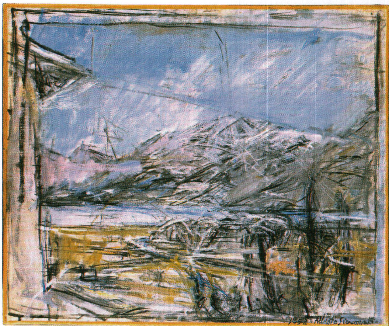
Paesaggio presso Maloja, 1953, collezione privata