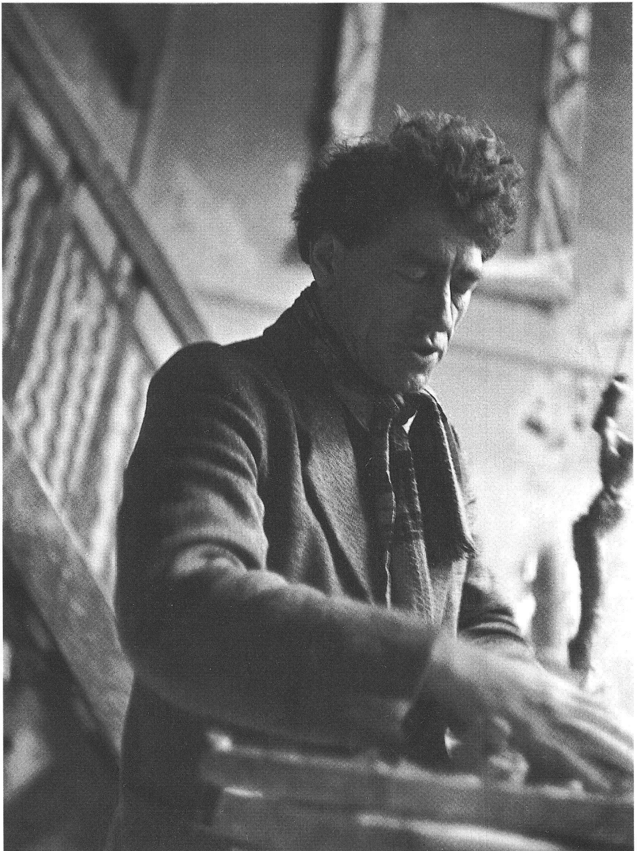
Alberto Giacometti, (manca la data)