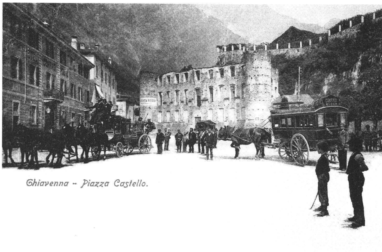
Chiavenna, Piazza Granda, 1899

La visita a Chiavenna è un'affascinante incontro con la storia. Sulla Piazza Granda, attuale piazza Castello, si apre il Palazzo Salis. Quasi per 300 anni, dal 1512 al 1797, Chiavenna si ritrovò sotto la dominazione dei Grigioni. Un tempo, nella sala degli specchi del piccolo Palazzo barocco, si ritrovavano per le danze dame eleganti e uomini di cultura provenienti da lontano. Oggi le porte si aprono solo per rari concerti o mostre d'arte.