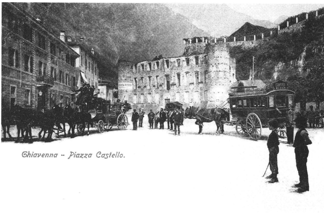
Chiavenna - Piazza Castello.

La visita a Chiavenna è un'affascinante incontro con la storia. Sulla Piazza Granda, attuale piazza Castello, si apre il Palazzo Salis. Quasi per 300 anni, dal 1512 al 1797, Chiavenna si ritrovò sotto la dominazione dei Grigioni. Un tempo, nella sala degli specchi del piccolo Palazzo barocco, si ritrovavano per le danze dame eleganti e uomini di cultura provenienti da lontano. Oggi le porte si aprono solo per rari concerti o mostre d'arte.