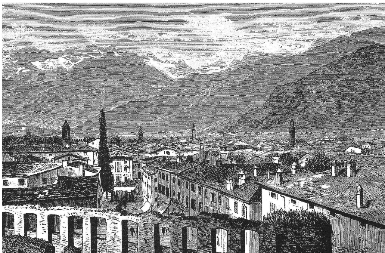
Chiavenna, silografia di Emil Petrovits, inizi del '900