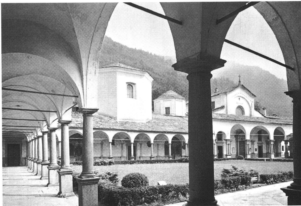
Chiavenna, Porticato di San Lorenzo

quale pertugio soffia aria fresca a temperatura costante, si conservano brisaola e salami, formaggi d'alpe e grandi botti di rovere per tenere al fresco il vino. Dentro alcuni di essi sono stati aperti anche ristoranti e trattorie dove si mangia casereccio e si beve bene.