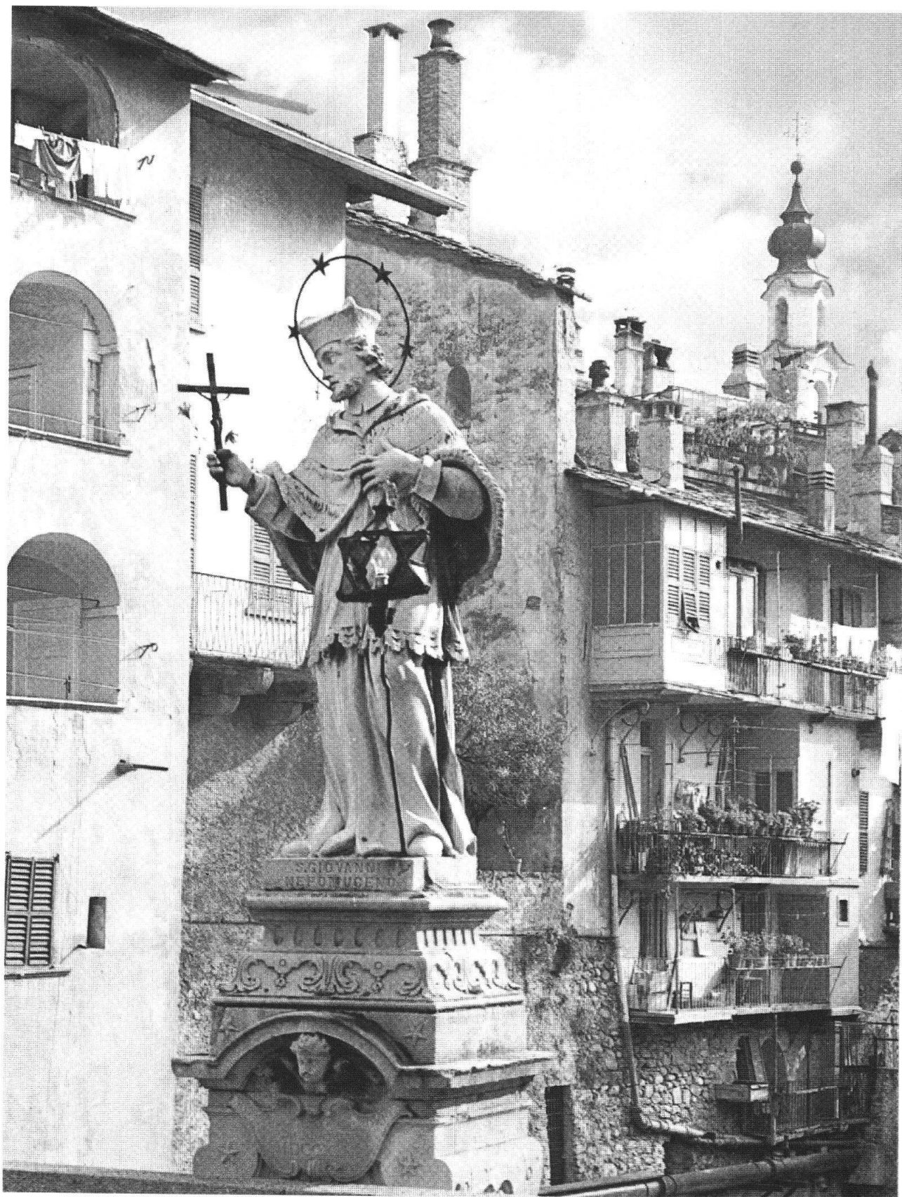
Ponte di Mezzo e di S. Giovanni Nepomuceno. È il ponte che da Chiavenna apriva la vecchia strada dello Spluga. Sullo sfondo loggiati delle case cinquecentesche costruite sulle mura sforzesche (XIV sec.)