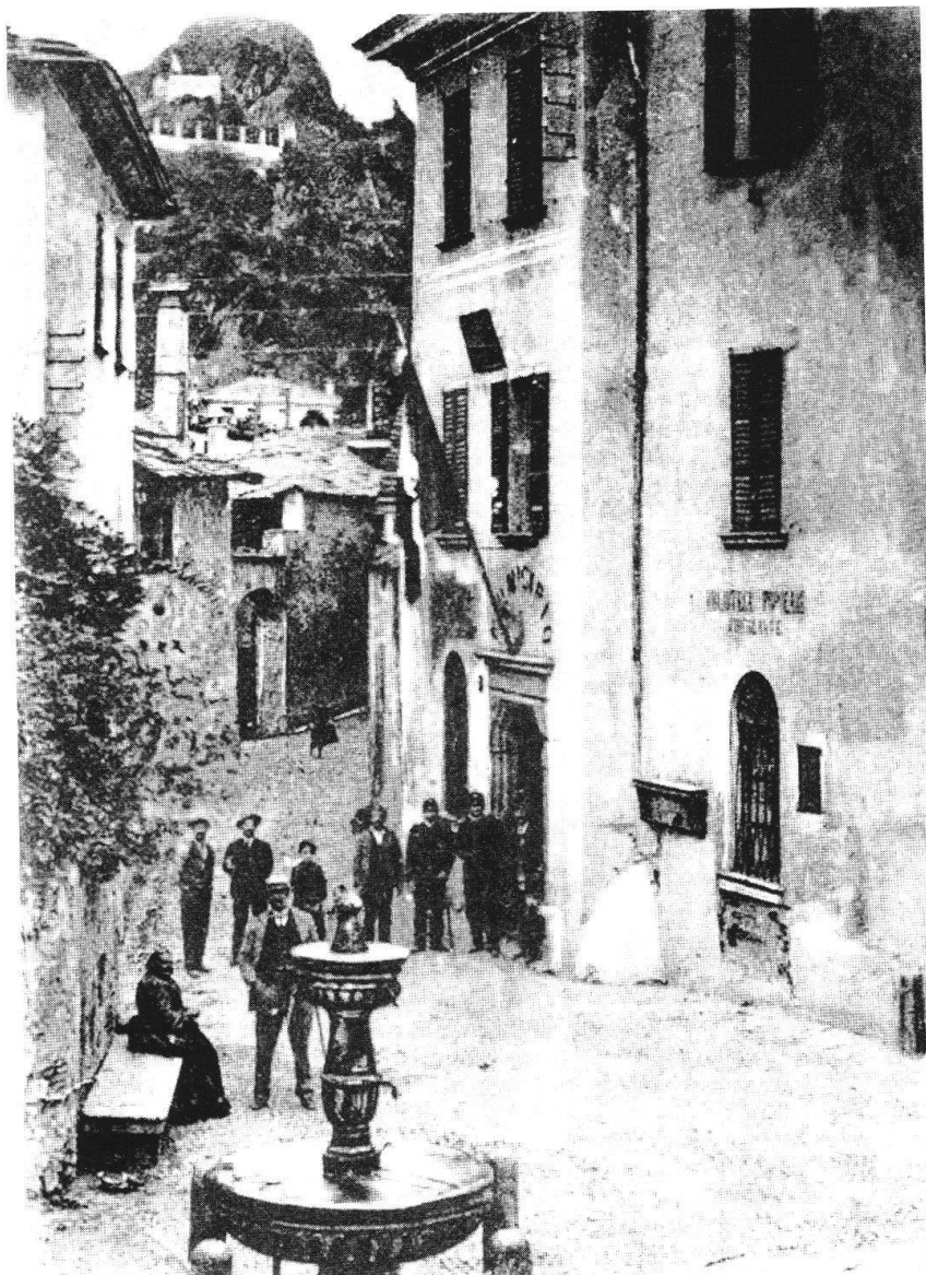
Chiavenna, Piazza San Péder, 1899