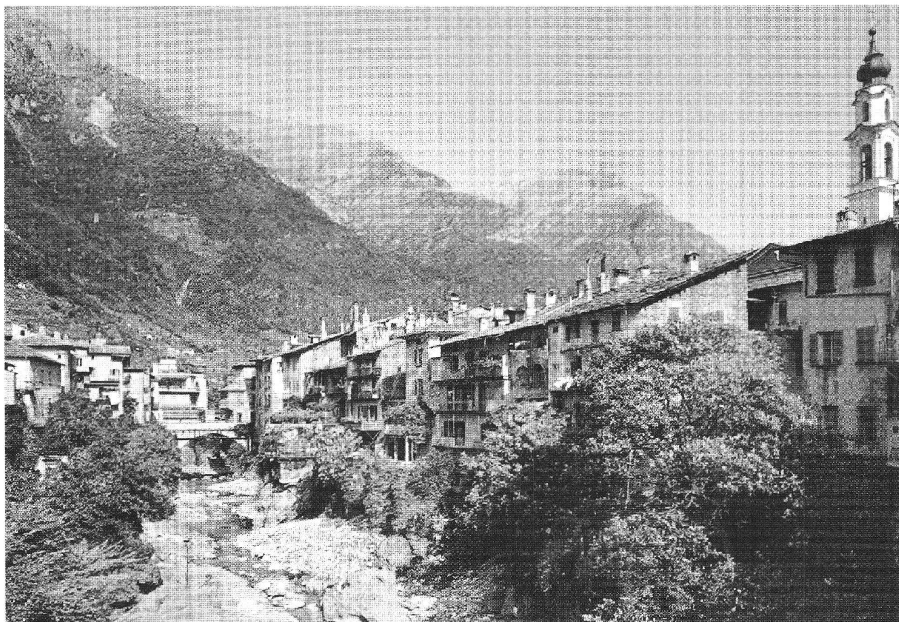
Chiavenna, fiume Mera

Leonardo da Vinci, in occasione di un suo passaggio nella zona, scrisse: «... si riesce a proseguire solo se si usano le quattro zampe».