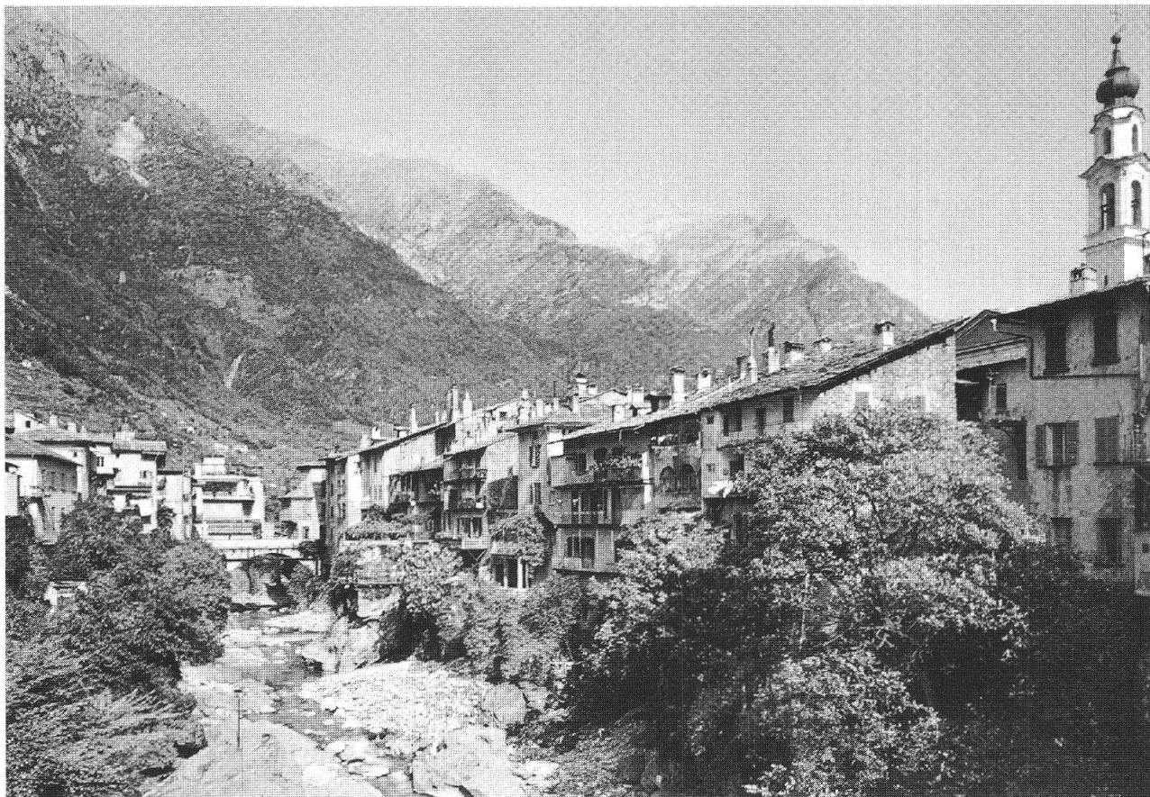
Chiavenna, fiume Mera

Leonardo da Vinci, in occasione di un suo passaggio nella zona, scrisse: «... si riesce a proseguire solo se si usano le quattro zampe».