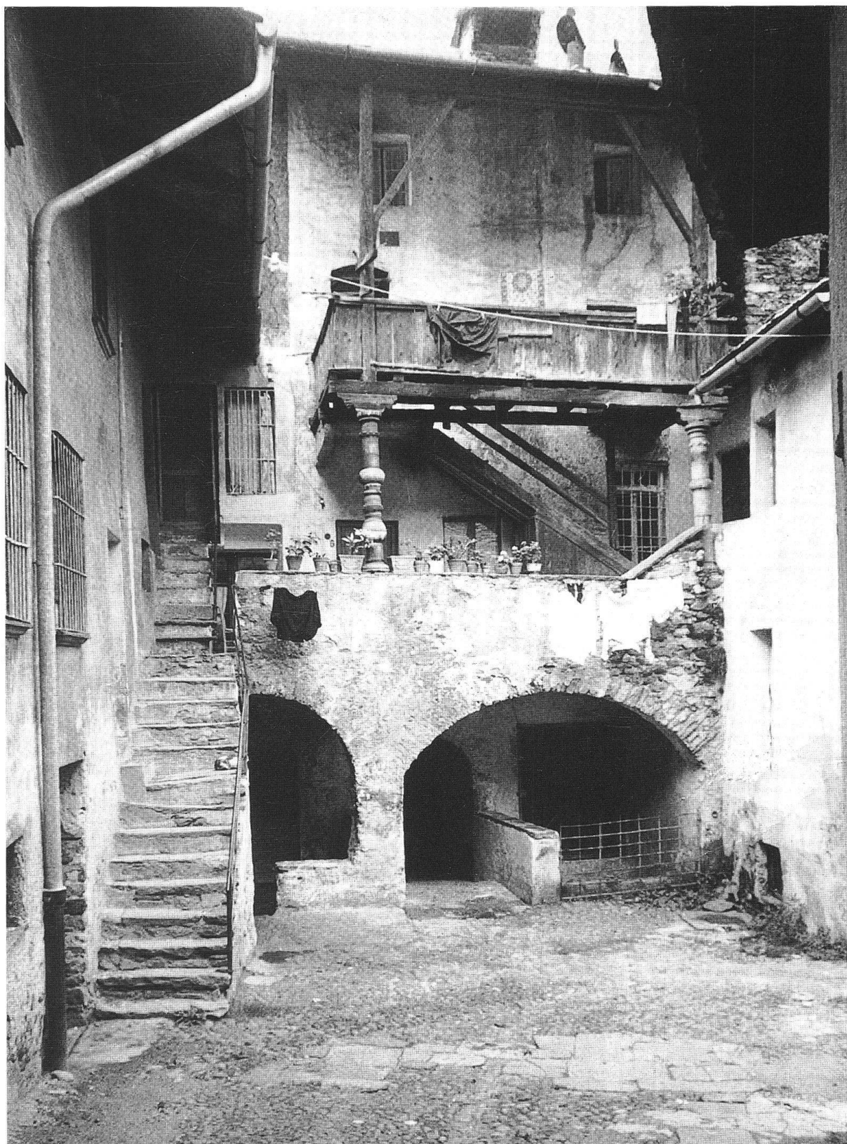
Chiavenna, «La Curt di asen»