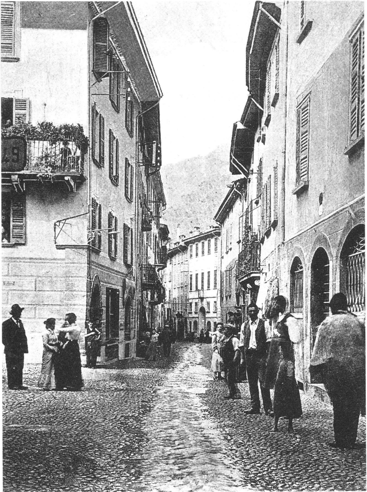
Chiavenna, Via Dolzino, 1899