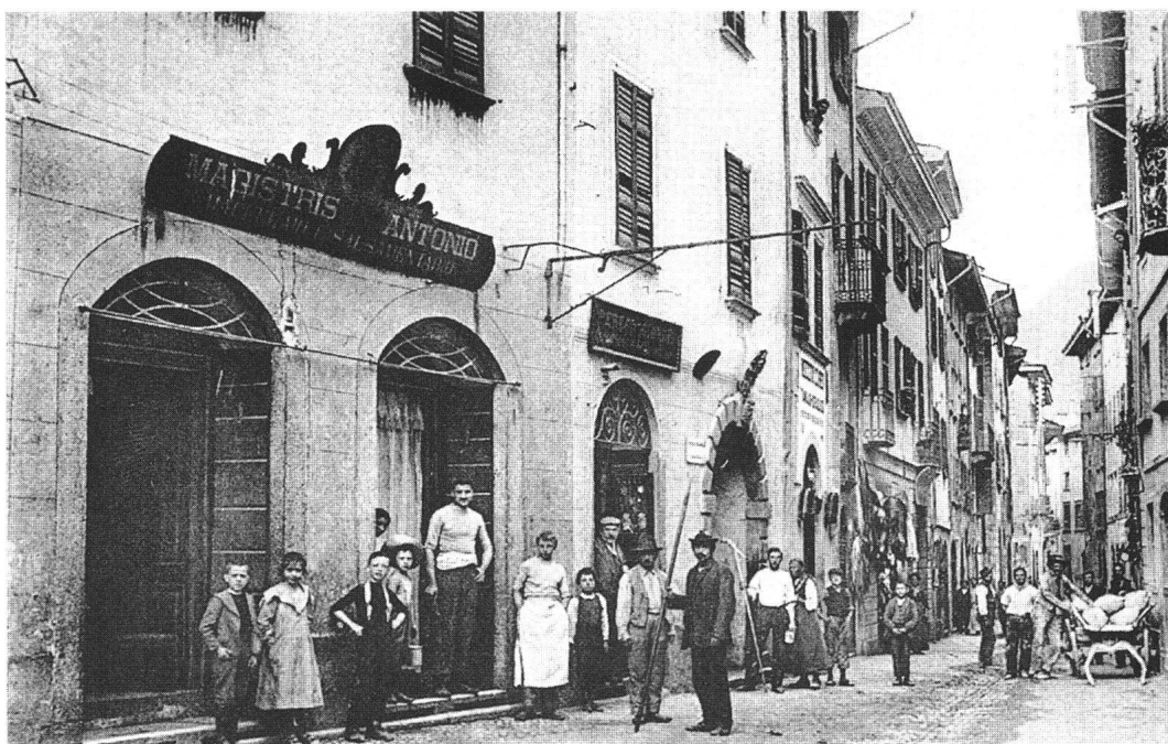
Chiavenna, Part de Mèz, 1912

dalla Svizzera, ha rafforzato gli scambi, le visite e l'amicizia tra chiavennaschi e Bregagliotti.