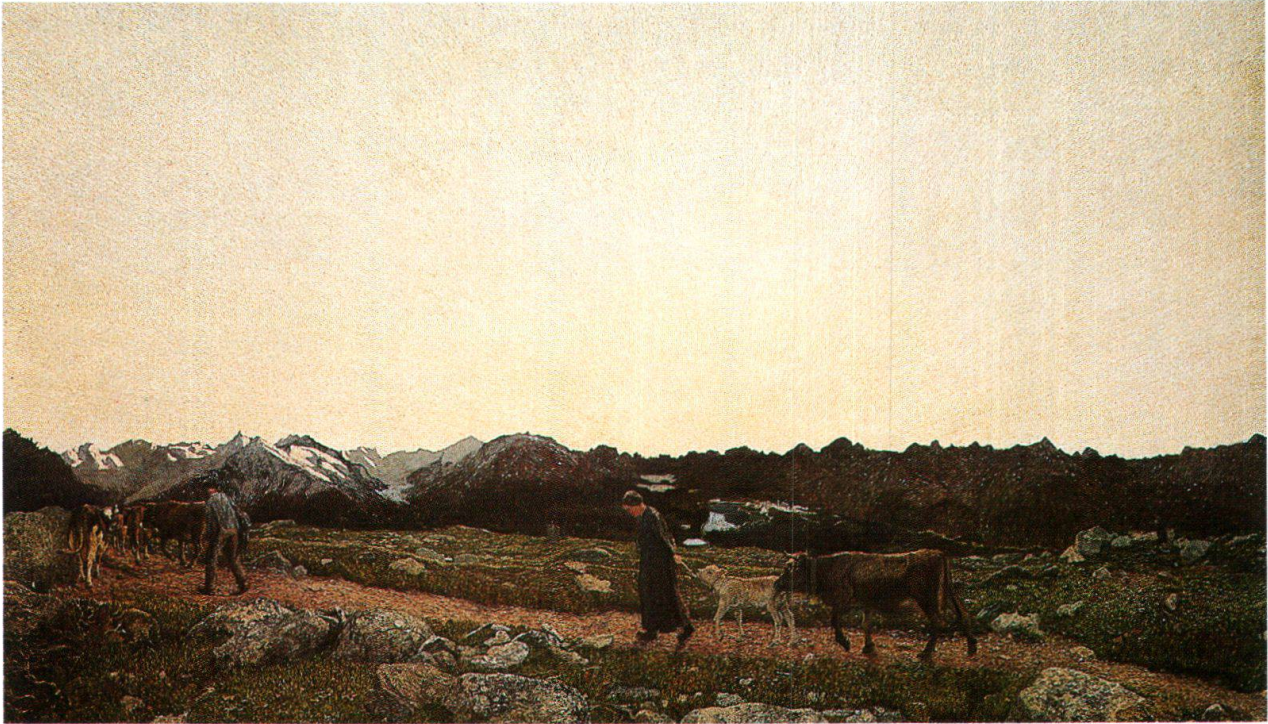
Il trittico della natura, parte centrale: La natura, [1898-99], Museo Segantini, San Moritz