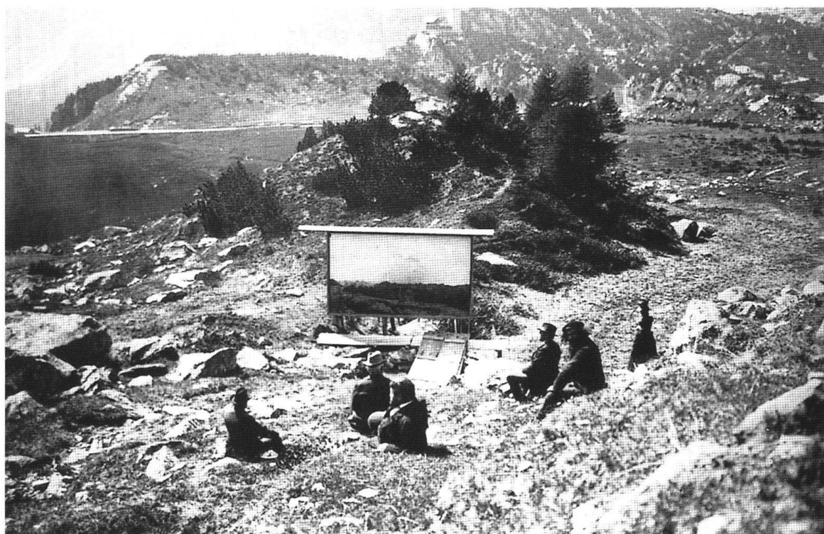
Giovanni Segantini con alcuni amici davanti al pannello centrale del Trittico, Maloja, 1898

Ho ricevuto la Vostra lettera e vi posso dire che il progetto del panorama è andato in fumo definitivamente. Sono contento che voi e Amiet lavoriate e stiate bene e che ricordiate qualche volta il Vostro G. Segantini