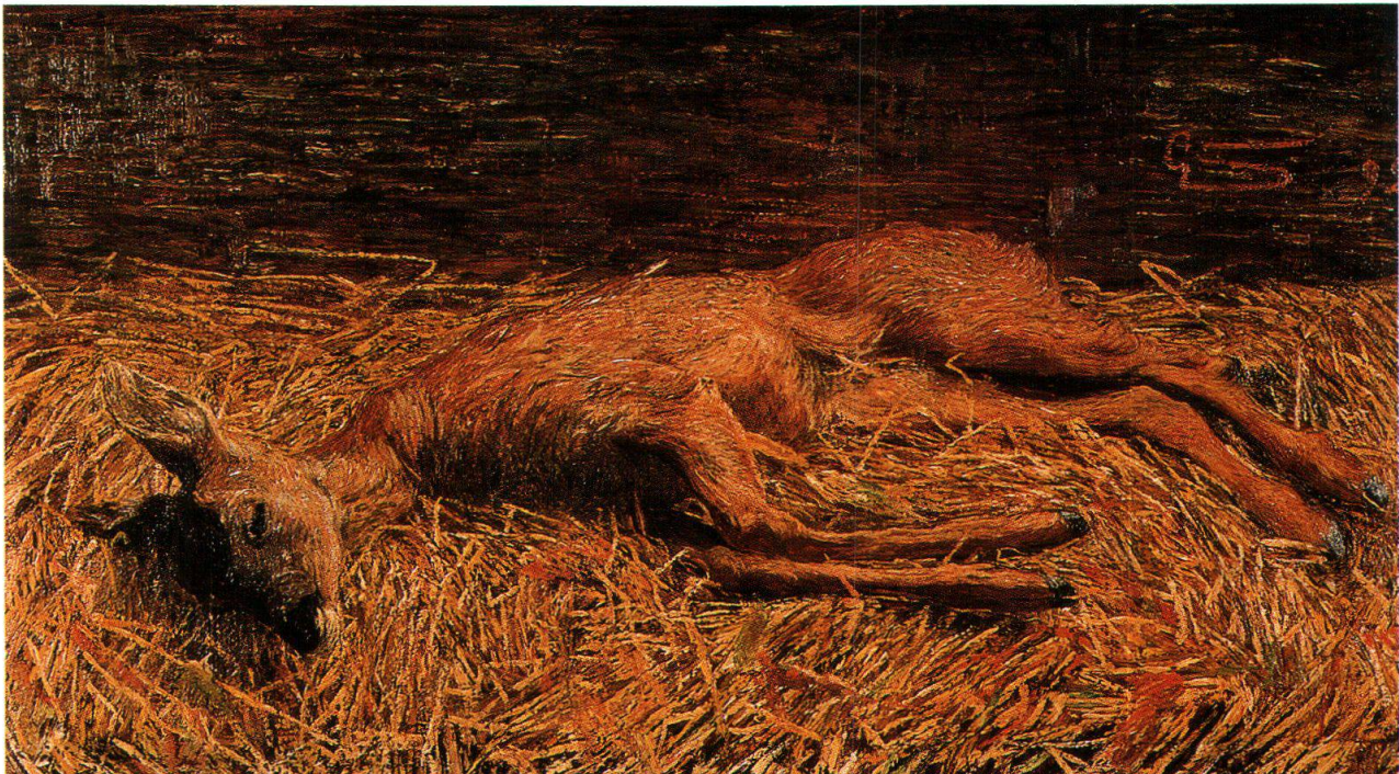
Capriolo morto, 1892, Museo Segantini, San Moritz

Segantini, che passava da uno stato di collasso all'altro, morì il 28 settembre alle ore 11 e 20 minuti di sera. Ho personalmente assistito l'ammalato giorno e notte.