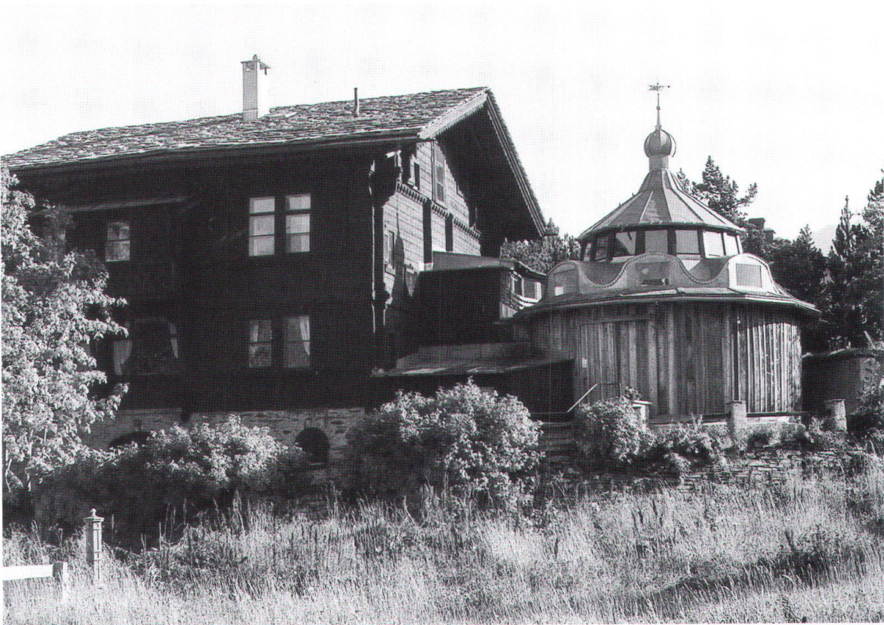
Maloja, la casa di Segantini con l'atelier