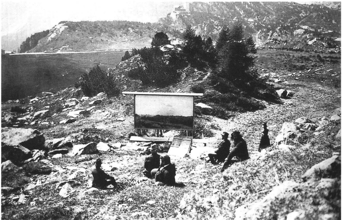
Giovanni Segantini con alcuni amici davanti al pannello centrale del Trittico, Maloja, 1898

Soglio 28-II-98 Caro Giacometti. Ho ricevuto la Vostra lettera e vi posso dire che il progetto del panorama è andato in fumo definitivamente. Sono contento che voi e Amiet lavoriate e stiate bene e che ricordiate qualche volta il Vostro G. Segantini