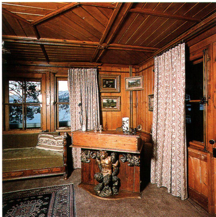
Interno della Casa di Segantini a Maloja/Maloggia

La capacità di comunicare, non importa in che lingua e con quale tipo di persona, e il piacere per la vita, contribuirono decisamente alla fama di Segantini che, a partire dall'età di 35 anni, era già uno degli artisti più quotati d'Europa. Il tempo che impiegava per le relazioni sociali qualche volta andava a scapito del tempo riservato alla pittura. A tale proposito Segantini scrive ad Alberto Grubicy di non dire agli amici milanesi che sarebbe venuto a Milano perché non voleva essere disturbato. Avrebbe avuto solo bisogno di un locale tranquillo per lavorare. Grubicy, in un'altra occasione, preoccupato, accenna a quanto sarebbe importante, per Segantini, abitare nel Castello Belvedere a Maloja in modo da «tenersi lontano da molte molestie».