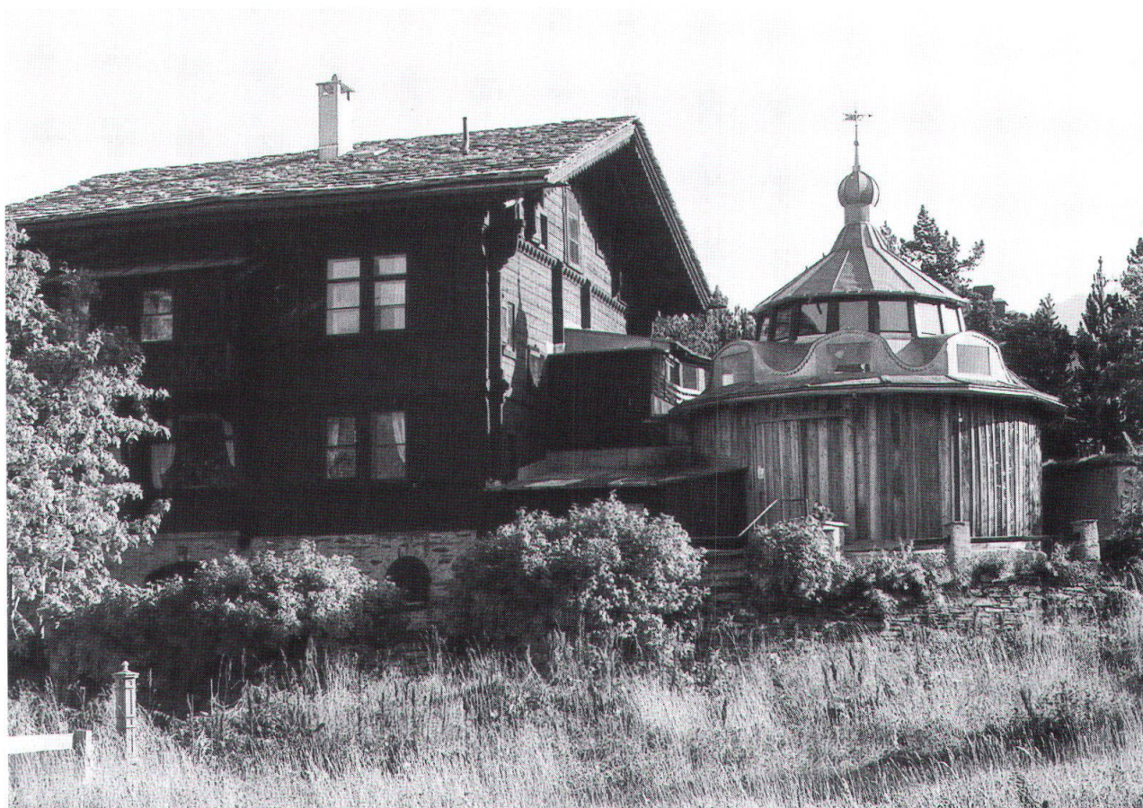
Maloja, la casa di Segantini con l'atelier