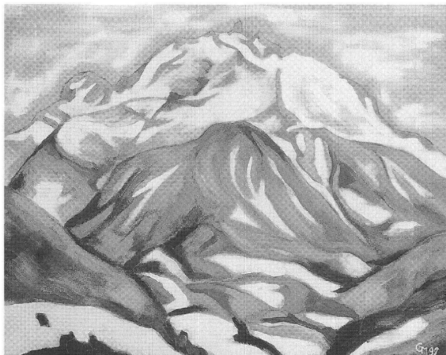
Piz Mitgel , 60x70, tempera, 1999

matici ed hanno avuto per nostra fortuna pittori che hanno ripreso il loro insegnamento. Basta analizzare in base a queste regole matematiche e geometriche quadri di Piero della Francesca, Paolo Uccello o Masaccio e poi di Gino Severini, Seurat, Modigliani o Matisse per capire perché le loro opere sono perfette. Da anni faccio questi esercizi da me nominati «esercizi di purificazione».