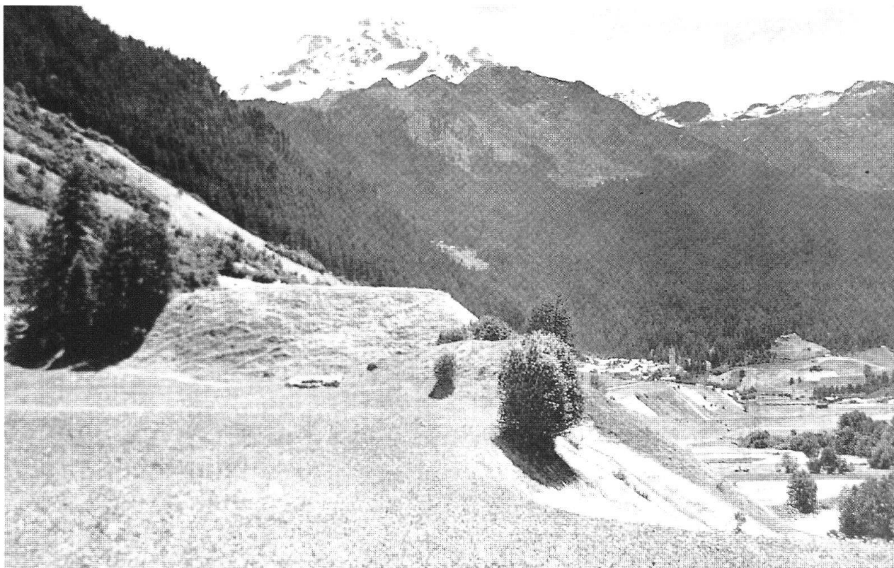
Il Padnal di Savognin, i cui scavi hanno dato alla luce reperti di ben cinque insediamenti dal Bronzo antico (2200-1600 a.C.) al Bronzo recente.