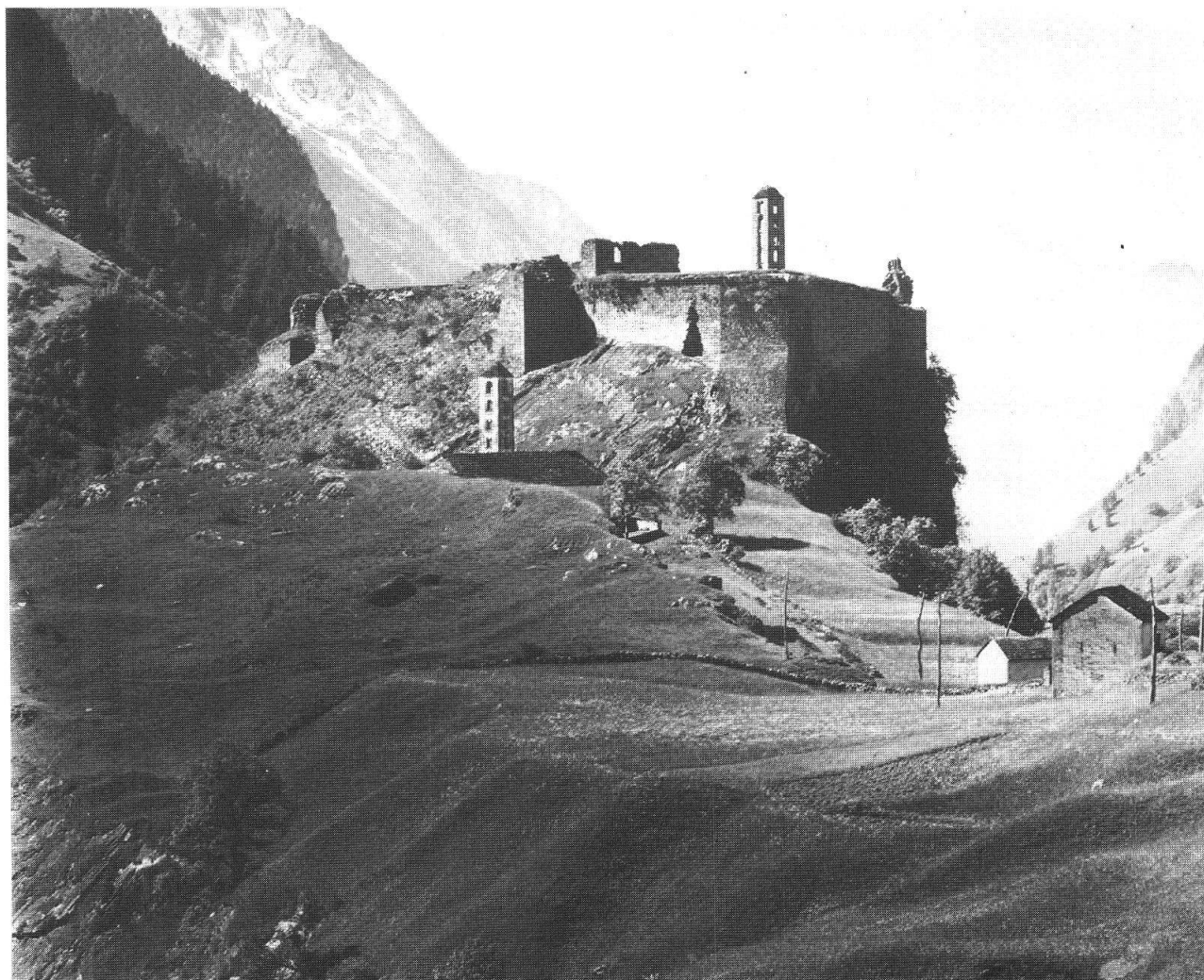
Rovine del Castello di Mesocco intorno al 1930