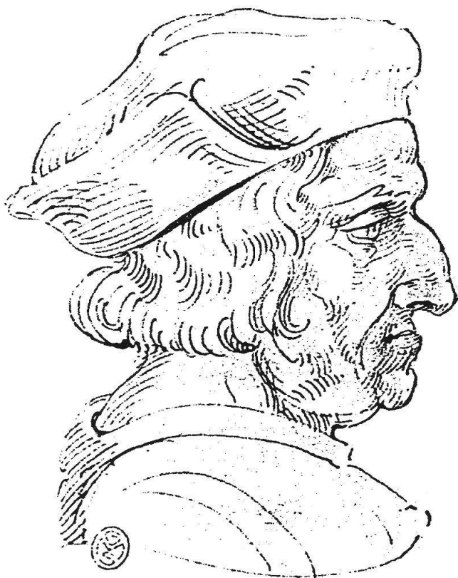
Ritratto a penna del Maresciallo Gian Giacomo Trivulzio, conservato nell'Archivio e Biblioteca trivulziana del Castello sforzesco di Milano