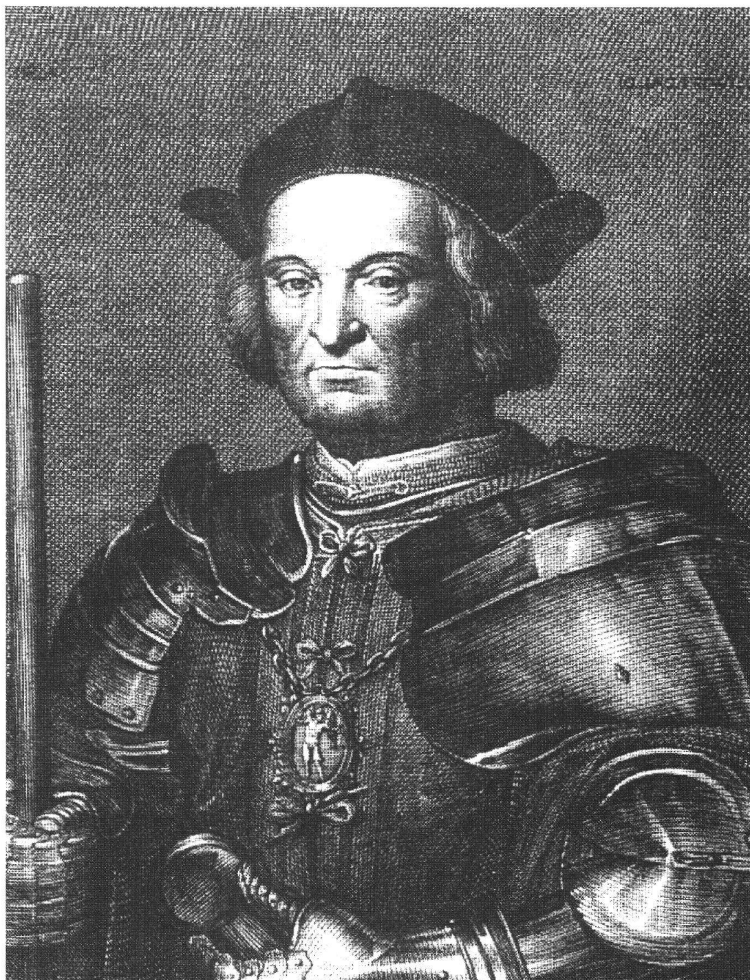
Gian Giacomo Trivulzio, incisione del primo Ottocento

indizij della luminosa carriera, che doveva percorrere. Morto il duca Francesco, il successore Galeazzo Maria nel 1467 lo impiegò in favore di Pietro Medici contro i fuorusciti fiorentini, quindi in soccorso del marchese di Monferrato contro Filippo di Savoia, e poscia contro i signori di Correggio. Guiderdone de' suoi servigj fu il comando di una squadra e la dignità di Aulico ducale.